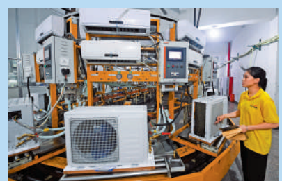
在浙江慈溪一家電器公司，工人在巡視空調自動化檢測線。