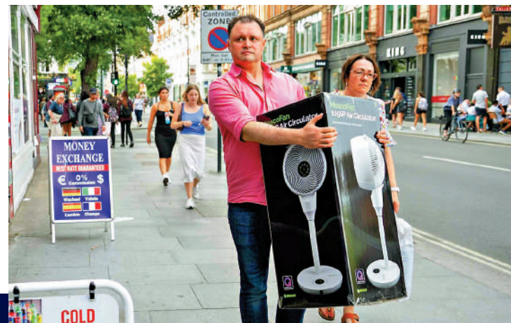
英國遭遇有紀錄以來最熱6月，民眾爭相購買電風扇。

據了解，「中國消暑八件套」在跨境電商平台上大受歡迎。據相關跨境電商平台數據顯示，今年入夏之後，國產太陽能風扇在英國、德國曾三小時內銷量激增641%，涼席、手搖扇單日增長超300%。