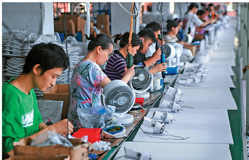
今年以來，海外市場對中國「清涼電器」需求飆升。圖為7月6日，工人在位於浙江省慈溪市的寧波榮電器製造有限公司生產電風扇。