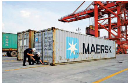
江門海關所屬外海關關員監管出口貨物集裝箱。