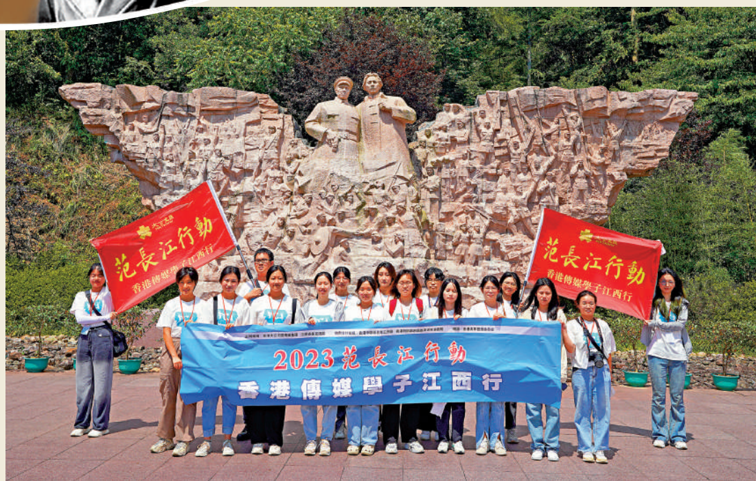
▲7月11日，2023「范長江行動——香港傳媒學子江西行」採訪團在井岡山革命博物館合影留念。