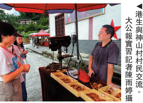
▲港生與神山村村民交流。大公報實習記者陳雨婷攝