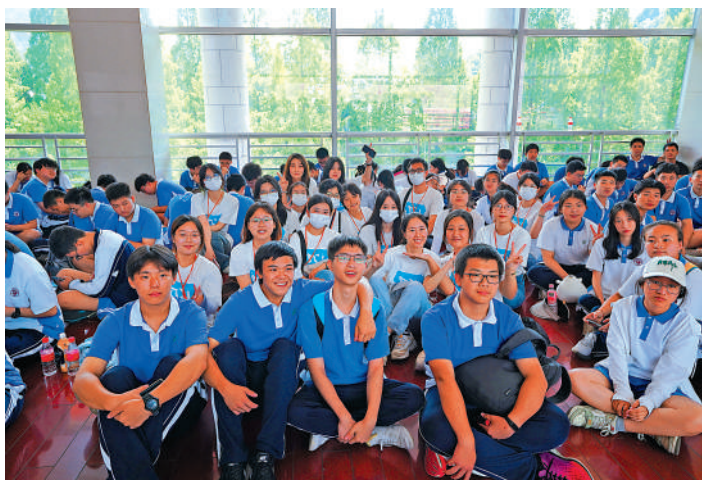
▲採訪團學子與在井岡山革命博物館偶遇的深圳中學學生合影。