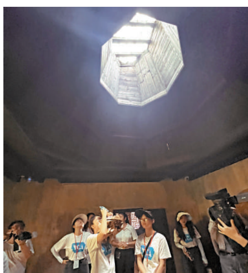
▲贛港學子參觀位於井岡山茅坪村的毛澤東八角樓故居。