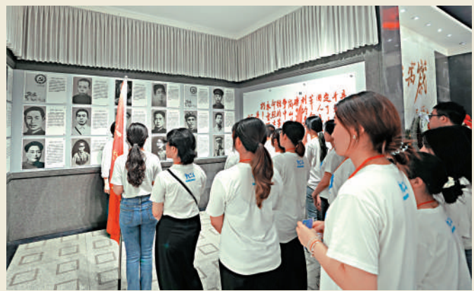
▶採訪團學子參觀井岡山革命烈士陵園。