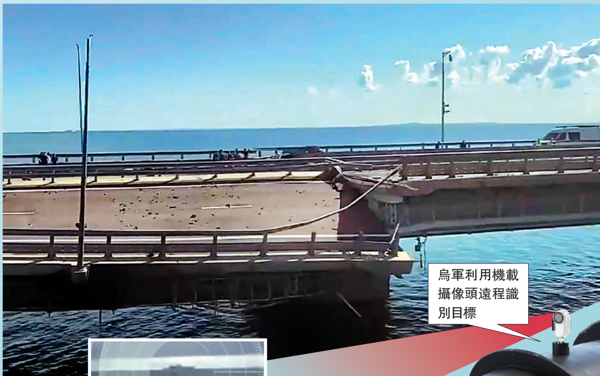
▶ 克里米亞大橋17日遭兩艘烏克蘭海上無人艇襲擊受損。

【大公報訊】綜合路透社、《紐約時報》、俄新社報道：克里米亞大橋17日遭兩艘烏克蘭海上無人艇襲擊，釀2死1傷。俄羅斯總統普京當晚與官員進行電視會議時表示，這是基輔政權發動的又一起「恐怖襲擊」，俄方將進行「嚴厲回擊」。俄軍18日對烏兩大港口城市敖德薩和尼古拉耶夫進行了大規模空襲。外媒關注到，烏克蘭海上無人艇結合了「現代導航技術、海上移動設備和傳統爆炸方式」，再加上體積小、造價低等特點，將持續對俄羅斯艦隊及超大基建造成嚴重威脅。