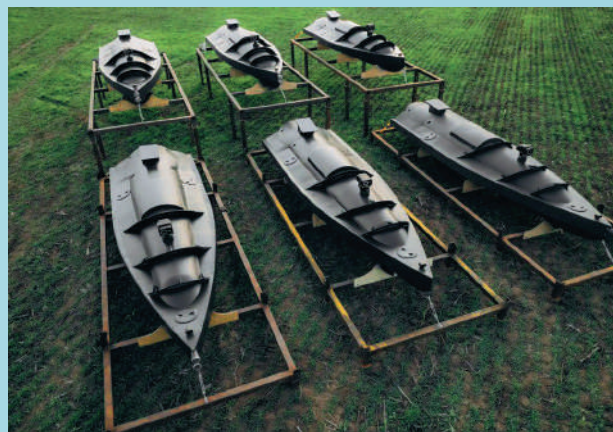
▲ 烏克蘭政府去年放出無人艇圖片。

普京17日將克里米亞大橋遇襲定性為「恐怖襲擊」，是「殘酷和毫無意義的行為」，並指這座大橋「已有很長一段時間沒有用於軍事運輸」。他指出，這是克里米亞大橋第二次遇襲，敦促有關官員要加強大橋周邊的安全保護措施，並矢言會進行回擊。