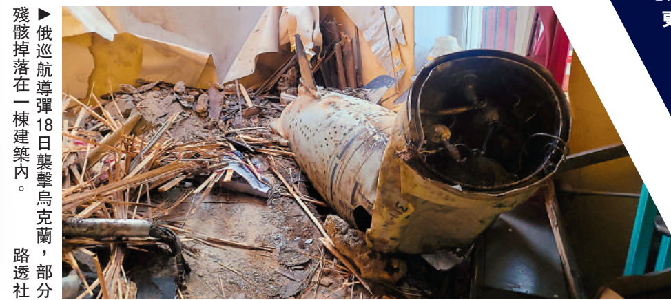
殘骸掉落在一棟建築內。