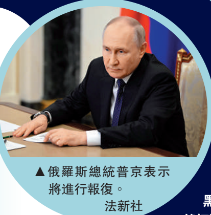
▲ 俄羅斯總統普京表示將進行報復。