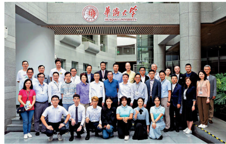
立法會考察團到華僑大學，了解大學的校史、培育人才理念和參觀校園設施。