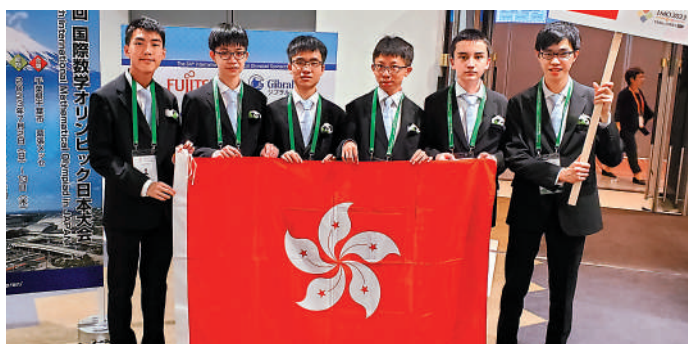
「國際數學奧林匹克」得獎者

她補充本局會持續於中小學以及校外加強推動STEAM（科學、科技、工程、藝術和數學）教育，並透過優化課程、加強教師培訓、為學校提供資源支援等，以啟發學生創新思維，讓有潛質的學生有更多機會發揮所長，擴闊視野。今年亦會向「資優教育基金」額外注資6億元，加強支援香港資優教育學苑的工作，舉辦更多本地、跨地域、全國和國際層面的培訓和比賽，並提供更多元化、高質素及具挑戰性。至於香港隊參加以上比賽的費用，全數由教育局資助。