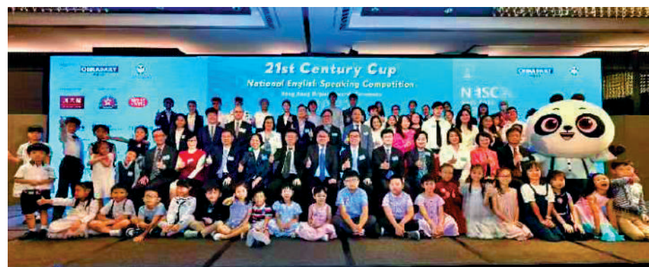
▲2023年「21世紀杯」全國英語演講比賽（香港賽區）頒獎禮7月15日在香港舉行。