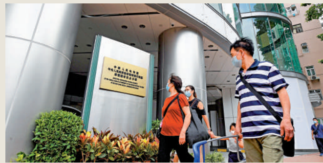
國務院任命董經緯為中央人民政府駐香港特別行政區維護國家安全公署署長。圖為國安公署大樓。

駐港國家安全公署於2020年7月根據《香港國安法》第四十八條成立，首任署長為鄭雁雄。鄭雁雄於今年一月接任中聯辦主任。