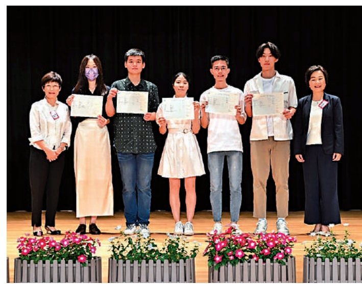
▲蔡若蓮到訪學校，勉勵考生「條條大路通羅馬」。

被問及今年DSE狀元數目減少，蔡若蓮指出今屆考生經歷三年疫情，能夠取得這個成績已經是付出了額外的努力。她續指，在各個學科取得好成績的同學有所增加，考生的總體表現是平均的。今年DSE是最後一次通識科考試，明年起將由公民與社會發展科取代。蔡若蓮表示，截至8月底將有4.5萬學生完成部分學習。這個新科目已精簡了原有通識科的內容，她相信通識科教師在適應及教學上不需太多調整。