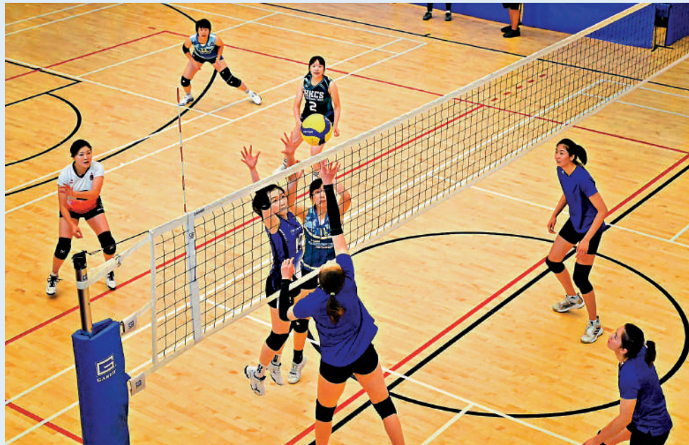
香港紀律部隊排球隊上月與國家女排進行友誼賽。