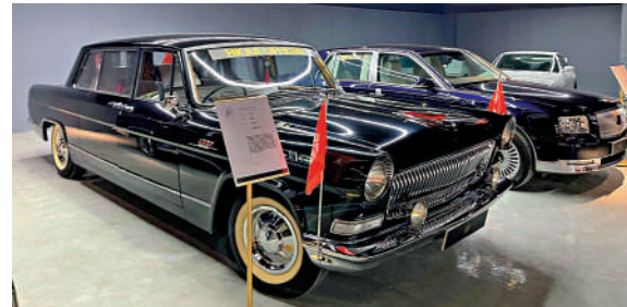
▲香港首個傳奇車珍藏館開幕，展出包括屬於元首級座駕車款的中國紅旗汽車。

珍藏館位於利南道，佔地三萬多平方呎，開放予公眾免費參觀，現場有工作人員介紹各款車輛的故事。有意參觀的市民，需提前一日致電23286138預約參觀名額。為保障車輛安全，車輛周邊會設置圍欄，參觀者不可觸摸車輛、上車等。