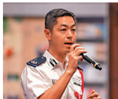
▲港島總區指揮官郭嘉銓感謝參與是次演習的人員。

警方希望透過今次演習進一步提升警隊與各部門於處理恐怖襲擊時的溝通及應變能力，以及測試各前線單位之間的協作能力。