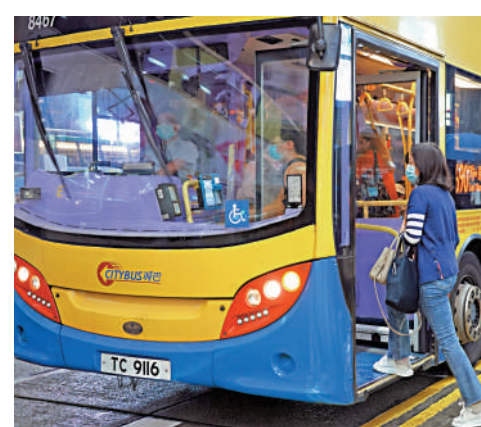
▲城巴現時有三千五百名前線巴士車長，當中絕大部分為男車長，女車長只佔百分之四。

「疫情時我們曾舉行招聘會，一開始幾乎無人關注，直到掛出招聘女車長的招牌，才陸續有人上前詢問，很多人才明白，原來女性都可以揸巴