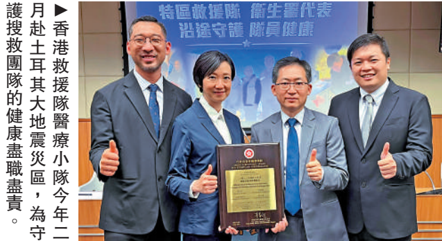
►醫療小隊成員表示，土耳其的救援行動為日後的救援工作提供了寶貴經驗。