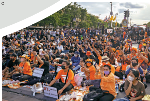
▶遠進黨支持者19日參加示威，抗議皮塔失去競選總理資格。

者須登記自己擁有哪些武器。警方稱，這將令幫派成員和不法分子更難獲得槍支。但即便沒有槍，新西蘭近年亦頻繁發生暴力襲擊事件，兇徒使用斧頭、刀具等肆意傷人。社交媒體上一條高讚評論說：「新西蘭這幾年走在下坡路。對於一個人口如此少的國家而言，我們的犯罪案件數量太多了。」