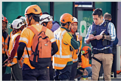
▲奧克蘭警方20日向目擊者問話。

蘭特持槍先後闖入新西蘭基督城的兩間清真寺，射殺51名穆斯林，並在Facebook上直播。塔蘭特2017年獲得槍支執照，共計合法購買了5件武器，包括用於襲擊的2支半自動步槍。