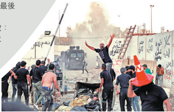
▼伊拉克示威者20日衝擊瑞典大使館。

新西蘭媒體稱，來自世界各地的參賽球隊和球迷聚集在奧克蘭，一些球員對安全問題感到擔心。新西蘭體育部長羅伯遜稱，很多參賽隊伍已經抵達，「他們都安然無恙。」意大利隊表示，受槍擊事件影響，他們的球員一度無法離開酒店，訓練被推遲。意大利隊將於24日與阿根廷對陣。