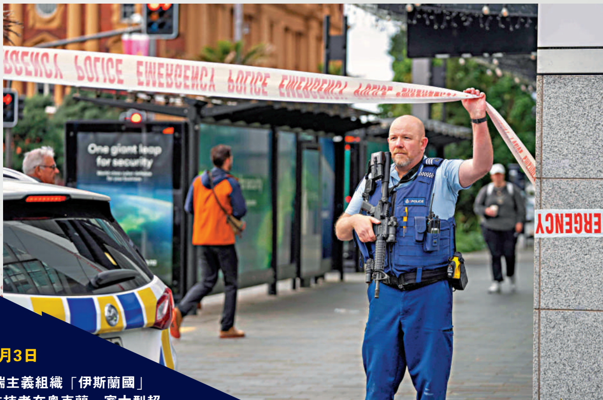
▲警方在槍擊案現場拉起警戒線。

【大公報訊】綜合澳洲廣播公司、BBC、《每日郵報》報道：新西蘭第一大城市奧克蘭市中心20日發生槍擊事件，包括槍手在內3人死亡；另有至少10人受傷，包括2名警察。槍手為一名24歲男子，他因為家暴被判居家監禁，行兇時還戴着電子腳鐐。據報道，他並無持槍證，暫不清楚他如何獲得槍支。新西蘭總理希普金斯稱，這是一宗孤立治安事件，不會對公眾造成進一步威脅，當晚的2023年女足世界盃開幕式照常舉行。