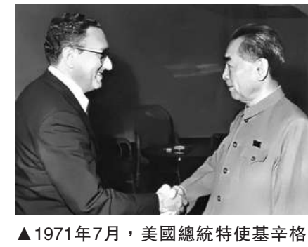
▲ 1971年7月，美國總統特使基辛格秘密訪華與周恩來總理會談。