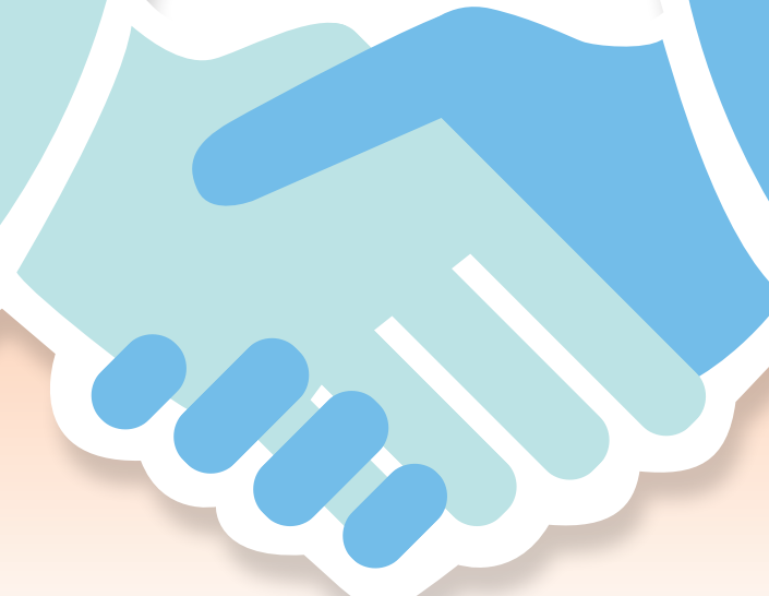
▲ 7月19日，在美國紐約舉辦的中國紡織品展會上，客商（左）在一家上海企業展位選看面料。 新華社

習近平主席曾不止一次引用過「一花獨放不是春，百花齊放春滿園」。這句古語蘊含着深邃要義。面對國際力量多極化、經濟全球化、文明多樣化的百年變局，各國唯有以百花齊放的思維，才能在外交上百尺竿頭，更進一步，實現「相互成就、共同繁榮」。反之，死守遏制思維、單邊主義、零和博弈，或以脫鉤、斷鏈相要挾，或以改造、圍堵來打壓，企圖讓中國百依百順，到頭來只有百害而無一利。