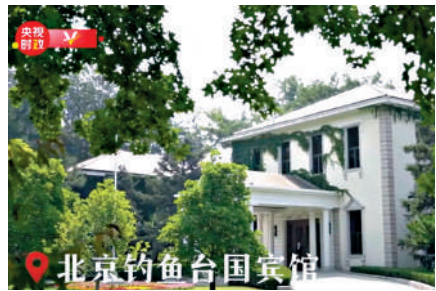
▲ 央視新聞報道顯示，中方將這次會見安排在釣魚台國賓館5號樓。

【大公報訊】據新華社報道：7月20日，國家主席習近平在北京釣魚台國賓館會見美國前國務卿基辛格。習近平指出，52年前，毛澤東主席、周恩來總理同尼克松總統和你本人以卓越的戰略眼光，作出中美合作的正確抉擇，開啟了中美關係正常化進程。中國人重情講義，我們不會忘記老朋友，不會忘記你為推動中美關係發展、增進中美兩國人民友誼作出的歷史性貢獻。展望未來，中美完全可以相互成就、共同繁榮，關鍵是遵循相互尊重、和平共處、合作共贏三項原則。