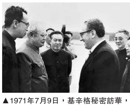
▲ 1971年7月9日，基辛格秘密訪華，葉劍英、黃華等人在南苑機場迎接。