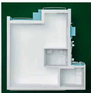
▲啟悅苑A座1樓至31樓高層有樓機，遠眺維港海景。