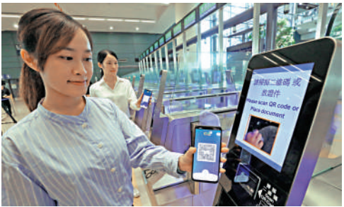
▲市民登記並使用「非觸式e-道」，辦理出入境手續將由15秒縮短至7秒。

管制站的e-道辦理出入境手續前首先在「非觸式e-道」應用程式開啟加密二維碼，再於「非觸式e-道」上的二維碼閱讀器上掃描上述二維碼；在進入e-道後於標示的位置望向鏡頭，配合容貌識別技術核實身份便可完成過關手續；在辦理入境手續時，e-道會列印一張載有該香港居民的逗留條件和期限的入境標籤，上述人士辦理