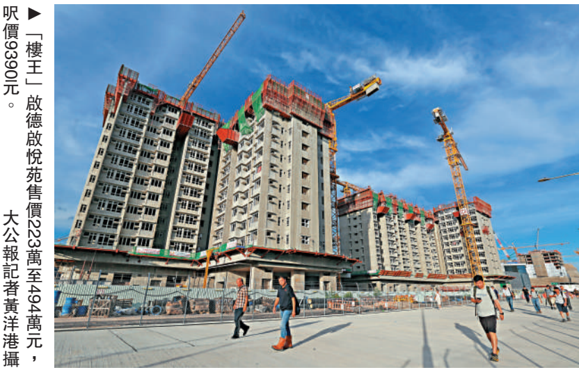
「樓王」啟德啟悅苑售價23萬至494萬元

新一期居屋及「白居二」將於本月31日起接受申請。六個新居屋屋苑間隔昨日曝光，合共提供9154個單位，是復建居屋以來最多的一次。單位以市價六二折出售，售價由149萬至494萬元不等，預計今年第四季攞珠，明年第一季揀樓。 有房委會委員估計，啟德啟悅苑最受歡迎，預料「白居二」超額認購率跟去年的25倍相若。