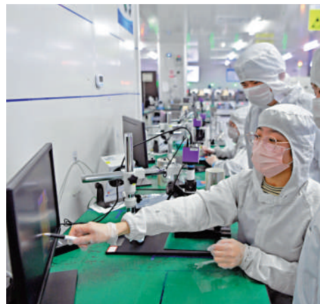
▲福建中科光電光電科技公司內，技術人員在探討光芯片生產工藝。

李春臨表示，為加快落實這些舉措，國家發改委會同有關部門強化相關工作，比如在推進全國統一大市場建設方面，持續開展妨礙統一市場和公平競爭的政策措施的清理，對市場准入和退出、強制產業配套或投資、工程建設、招標投標以及政府採購等領域的突