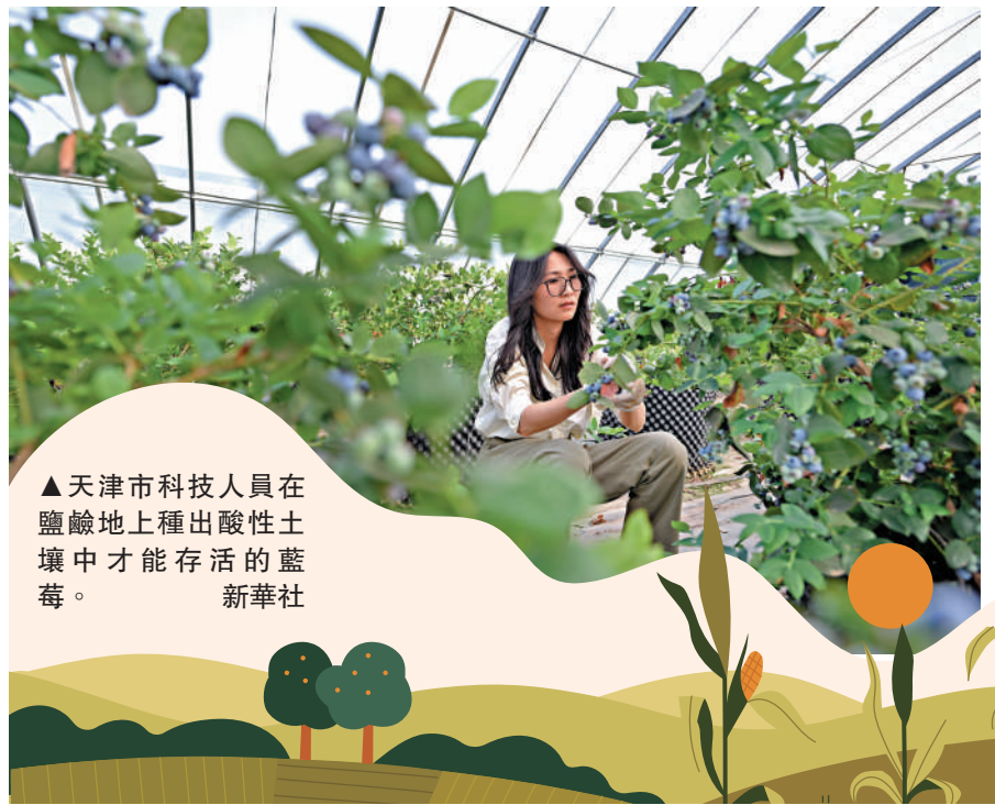
▲天津市科技人員在鹽鹼地上種出酸性土壤中才能存活的藍莓。