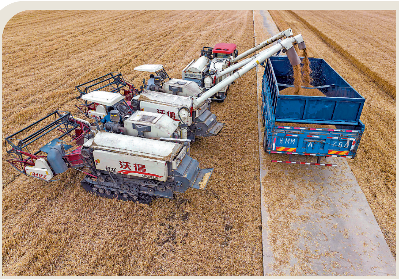
▲7月20日召開的中央財經委員會第二次會議強調，要壓實耕地保護責任，確保18億畝耕地紅線決不突破。圖為5月30日，在江蘇省泰州市，農民在田間將小麥裝車。