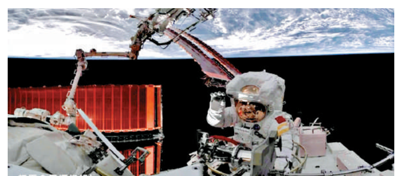
圖為神十六乘組在軌安裝全景相機B。

根據計劃，後續，航天员乘組還將開展大量空間科學實(試)驗，參與完成多次應用載荷出艙安裝任務。