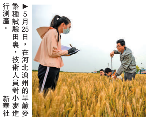
▲5月25日，在河北滄州的旱澇麥行測產。

建灌區、暢渠系，提高農業綜合生產能力。河套大型灌區續建配套與現代化改造工程建设不斷推進，「十四五」期間改造灌溉面積298.9萬畝。湖北省荆州市太湖港灌區新建擴建工程開工，灌區灌溉面積將擴大至41.37萬畝。灌區工程是發展農業灌溉、保障糧食生產的重要基礎設施。「十四五」期間水利部將對120多處大型灌區續建配套和現代化改造，項目完成後，預計可新增和改善灌溉面積約8800萬畝，新增年節水能力約70億立方米。