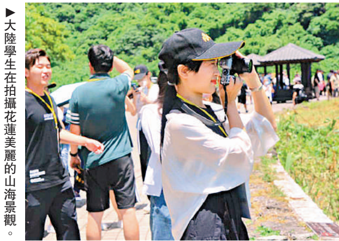
大陸學生在拍攝花蓮美麗的山海景觀。

【大公報訊】據中新社報道：來自大陸五所高校的37名師生在台灣的參訪行程進入第七天，21日來到花蓮太魯閣公園觀賞九曲洞步道、清水斷崖等景點，領略台灣東部自然風光。 據介紹，太魯閣公園內高山突兀，峽谷深邃，奇景美不勝收，極具特色之處，尤以雄偉壯麗、近乎垂直的大理岩峽谷景觀聞名。綜合中時新聞網、中天新聞網等台媒報道，當日行程由馬英九先生陪同，大陸師生對太魯閣中的九曲洞步道地形感到好奇，也被稱作「台灣十景」之一的清