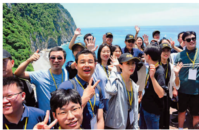
大陸學生21日上午在清水斷崖觀景台合影。

應馬英九基金會邀請，師生團一行於15日抵台開啟交流，後續還將到訪平溪等地，計劃於23日返回大陸。