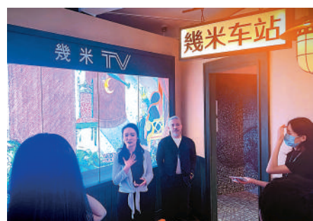
▲7月20日，《遺失的幾米世界》沉浸式互動畫劇展主創團隊成員在京介紹展覽情況。

表示，希望觀眾們感受幾米繪本所表達的意象，從展覽中獲得繼續向前的力量。展覽投資方，北京保利劇院管理有限公司總經理姚睿受訪時表示，希望今後能與更多台灣優秀文化藝術類IP合作，搭建文化交流、青年交流平台，聯手將文化精品推向國際舞臺。