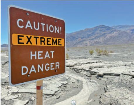
▲美國加州死亡谷的酷熱天氣標誌牌。

浪威脅着大自然為人類提供食物的能力。英國利茲大學大氣科學教授約翰·馬沙姆說，「我們的食物系統是全球性的」，受氣候影響，農作物減產的風險越來越大，「這將真正影響糧食供應和價格」，這是未來幾十年裏真正讓人害怕的事。2018年歐洲熱浪導致中歐和北歐地區多次農作物歉收，產量損失高達50%。2021年加拿大太平洋沿岸的高溫導致約10億隻海洋動物死亡。