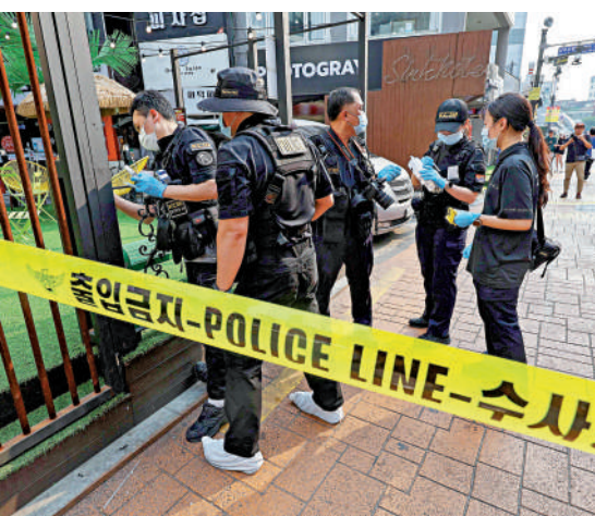
▲韓國警方21日在首爾地鐵站襲擊現場進行調查。

據悉，該名男子過去曾有17次犯罪前科。警方表示，疑犯犯案當時未飲酒，還在現場高喊：「我不想活了！」警方還在調查兇手與受害者之間的關係，以及具體犯案動機，並透過現場附近的監視器畫面掌握事發經過，釐清更多案件細節。