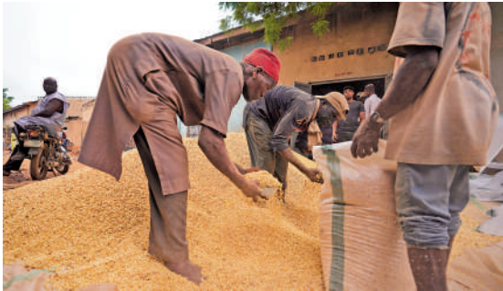
▲俄烏衝突和印度大米出口禁令，對非洲國家糧食供應影響大。圖為一名工人14日在尼日利亞卡諾的達瓦瑞國際市場整理穀物。

聯合國世界糧食計劃署首席經濟學家胡賽因稱，各國已經在應對令人頭疼的食品通脹，尤其是窮國，「當你特別依賴食品進口，債務負擔沉重時，貨幣在貶值，利率在上升……如果你是一個靠進口食物或化肥的窮國，你就有麻煩了。」