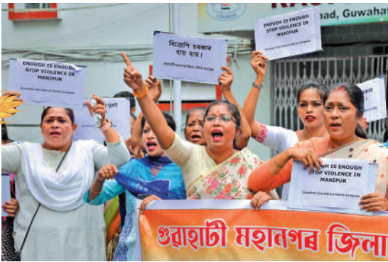
▲印度阿薩姆邦婦女21日參加反對近日印度種族暴力的示威活動。

曼尼普爾平地住民多為梅泰族，佔全省人口約53%；山地部落多為庫基族和那加族，佔全省人口約40%，享有當局給予特殊的部落地位。梅泰族不滿山地部落享有特殊地位，兩個種族在5月3日爆發激烈衝突。印度全國婦女委員會收到投訴，除了視頻中的兩名女性外，衝突暴亂期間有更多女性受害。