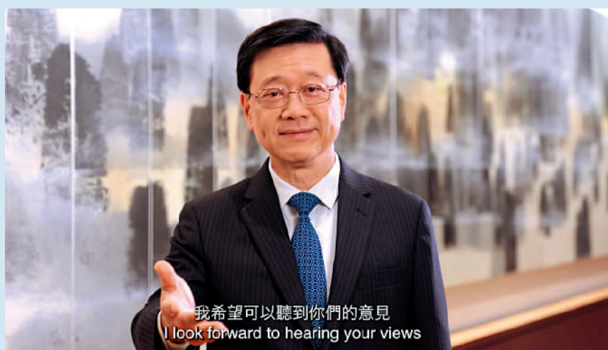
我希望可以聽到你們的意見 I look forward to hearing your views

行政長官李家超在宣傳影片中表示，知道市民過得幸福開心，我就開心，因為大家臉上的笑容，就是我們團結奮鬥的目標和動力。