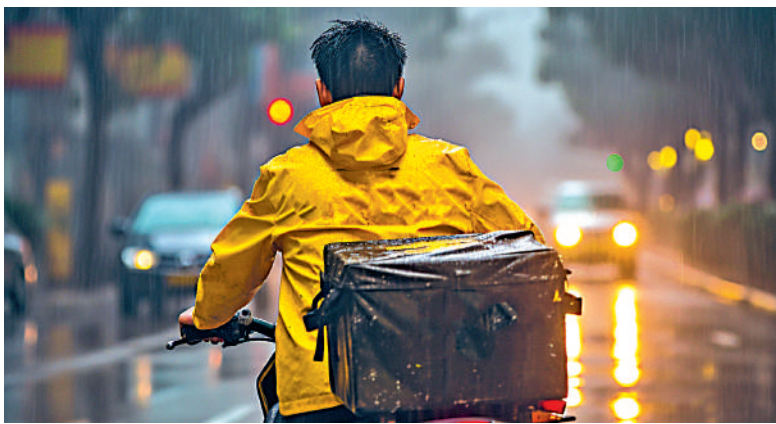
▲民營企業在創造就業、出口貿易等方面的作用很明顯。大公MJ製圖