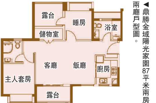
◀鼎勝金城陽光家園87平米兩房兩廳戶型圖。