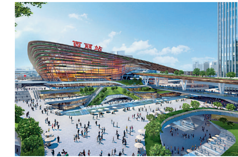
◀位於南山區的西麗高鐵站已於去年動工，將規劃為城市綜合交通樞紐。