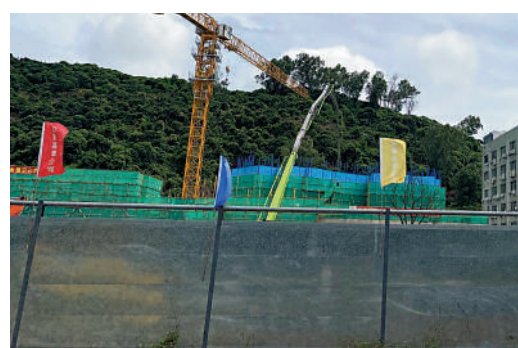
▲總章翡翠公館目前正在施工階段（左圖），規劃為5幢高層住宅（上圖）。

樓花項目 鄰近大沙河生態長廊的總章翡翠公館，佔地1.3萬平米，總建築面積5.8萬平米，由5幢約百米的高層住宅和3層地下室組成，提供500個住宅單位，目前正在施工，尚未公布戶型圖和售價，預計明年開售。