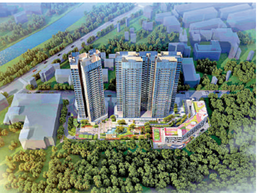
▲鼎勝金城陽光家園周邊環境優美，背靠塘朗山，面朝大沙河。

周邊環境方面，項目背靠塘朗山，面朝大沙河，自然環境不錯。不過周邊有不少工業廠房，旁邊是明亮科技園。對於在南山區上班族來說，如果定價較為合理，該樓盤不失為新盤上車選擇之一。