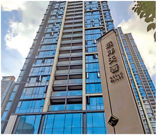
▲遠洋天著外立面採用類玻璃幕牆加高級色調鋁板，顯得高端大氣。