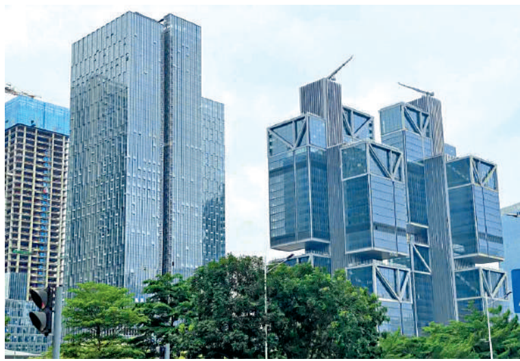
◀留仙洞總部基地吸引不少科企進駐，有望成為深圳新的「造富」片區。