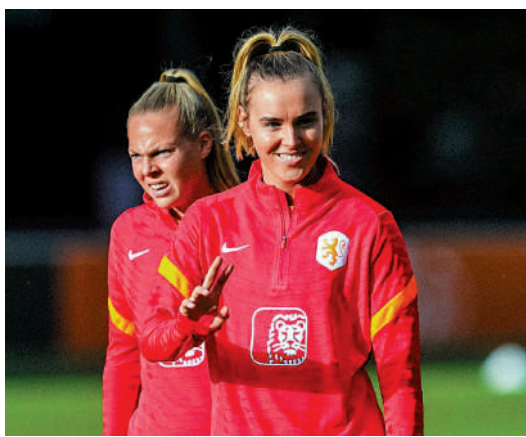
足一半，難望阻止荷蘭取勝。

荷蘭女足世界排名第9，剛好失落第一級種子身份，更被分入「一姐」美國的E組中，若要晉級淘汰賽，荷蘭首輪對葡萄牙的賽果特別關鍵。雖然荷蘭有射手美丹瑪因傷缺陣，不過陣中仍有全能中場盧德主持大局，她剛加盟英超勁旅曼城，預計會以精準傳送及個人技術左右大局。荷蘭近8仗錄得5勝3和佳績，葡萄牙近8仗輸