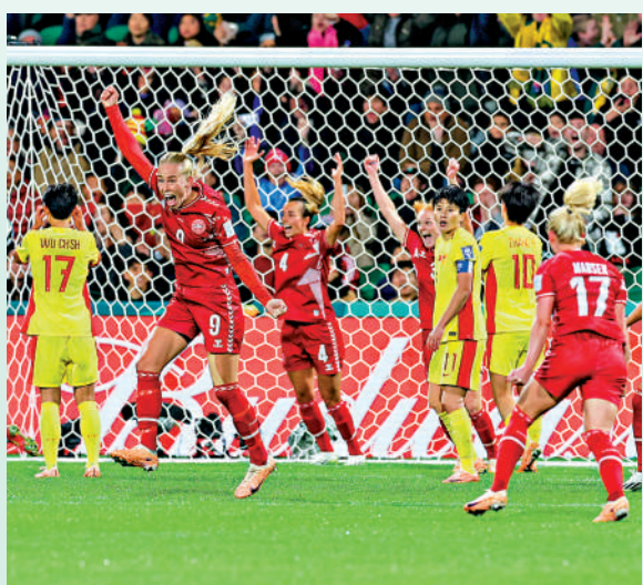
▲丹麥憑雲絲加特(9號)頂入奠勝球。