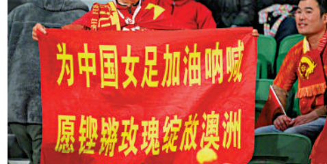
▲球迷入場為中國隊打氣。