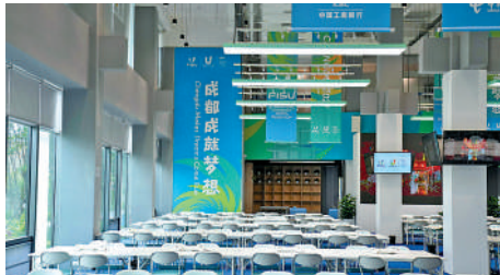
▲大運村內的媒體中心設計簡約。