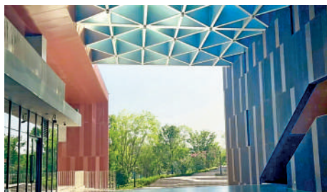
▲村內設施都體現綠色低碳理念。

綠色低碳大運村實現可持續利用的價值，賽事期間是國際青年的成都家園，賽事完結後則將繼續服務大學師生和這座城市。「綠色低碳」及可持續利用融入到建設和運行。比如大運村生活服務中心的建築主體部分架在山坡上，而周邊落到山腳下與道路銜接。一條半室外街道形成一頭朝東北、一頭朝南的兩個「喇叭口」，利用「伯努利效益」，通過自然風的引導獲得舒適共享空間，減少建築能耗、降低建築碳排。這個設計不需空調，1年能節省70000度電，按1個普通家庭1年3600度電計算，70000度電可滿足1個家庭20年用電量。