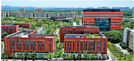
▲代表團入住的10棟公寓均由成都大學學生宿舍改造。

大運村最大亮點是它坐落在成都大學校園內，依託校園建設、改造而成，總佔地面積約80萬平方米，總建築面積約66萬平方米，能容納約11000人入住。代表團入住的10棟公寓均由成都大學學生宿舍改造，將學生宿舍四人間通過拆裝為兩人間或單間，希望世界各地的青年能感受到中國大學宿舍的溫馨與舒適。同時，大運村設置了互動交流、互動體驗、展覽展陳3大類文化活動，大熊貓、金沙文化、川劇臉譜、蜀繡等元素都有展現。世界青年通過參加主題晚會、體驗中國非遺技藝、參觀主題藝術展，就能感受到「中華文化、巴蜀韻味」。