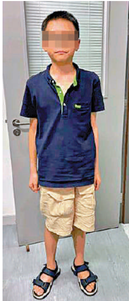
▲一位12歲男童被母親遺棄於廣華醫院急症室。

【大公報訊】一名12歲男童上周五（21日）被遺棄在廣華醫院急症室，醫院職員報警，警方調查發現男童父母並非港人，亦不是定居於香港。消息指，目前男童母親身處內地，警方正循虛見方向調查，並已與男童母親取得聯絡，着她來港協助調查。