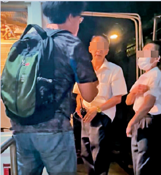
▲有居民不齒保安行為，上前理論，女保安竟辱罵對方。