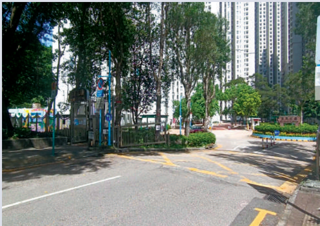
▲富寧花園另一邊的閘口，車閘長期打開，車輛可自由出入。