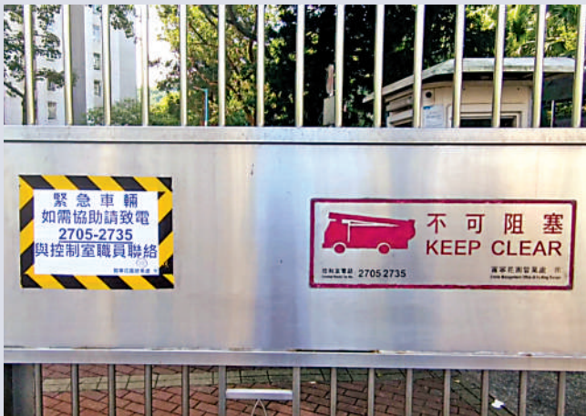
▲涉事大閘事後貼告示，指緊急車輛可致電控制室要求開閘。