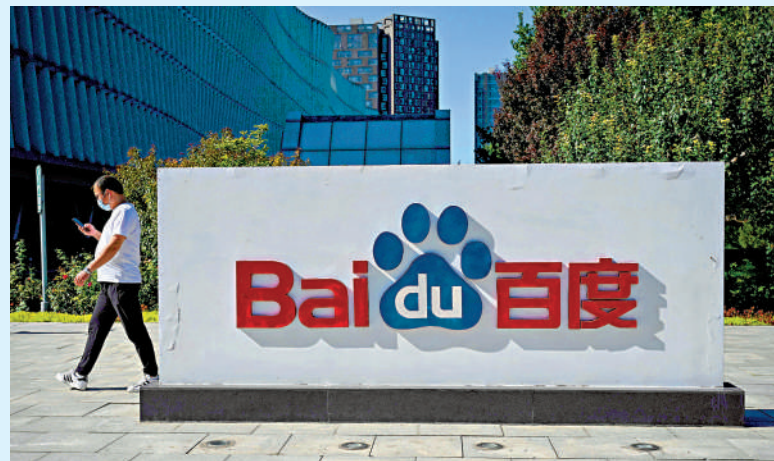
▲百度的百度雲僅以此微優勢，位列中國AI公有雲服務市場之冠。