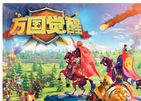
▲《萬國覺醒》半年收入達218億元。

雖然在2022年隨着後疫情時代的到來，全球手遊收入出現不同程度的回落，但2023年上半年海外手遊市場收入達309億美元（約2410億港元），逆轉下滑趨勢。其中，美國和日本仍然是中