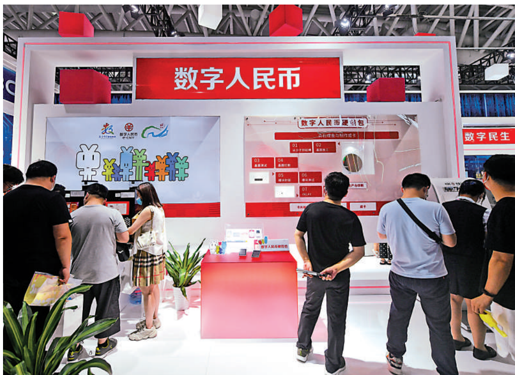
▲《辦法》明確約束數據處理，適用範圍包括數字人民幣等金融業務。

人行表示，數據處理者在內地境內收集和產生的數據，法律、行政法規有境內存儲要求的，應當在境內存儲。非經人行和其他有關主管部門批准，數據處理者不得向國際組織和外國金融管理部門提供境內存儲的數據。數據處理者不得有意拆分、縮減出境數據以規避申報數據出境安全評估。重要數據的數據處理者應自行或者委託檢測機構，每年組織開展一次全面的數據安全風險評估工作。