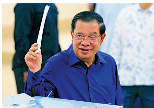
▲柬埔寨首相洪森23日為大選投票。

【大公報訊】綜合新華社、路透社報道：執政的柬埔寨人民黨24日宣布贏得第七屆全國大選。中國外交部發言人表示，中方祝賀柬埔寨人民黨在洪森主席帶領下贏得大選。 柬埔寨23日舉行第七屆國民議會選舉投票，共有柬埔寨人民黨、奉辛比克黨等18個政黨參加選舉，角逐125個席位，獲多數席位的政黨將負責組建新一屆政府。由首相洪森領導的柬埔寨人民黨24日表示，該黨在下議院125個國會議席中贏得120個議席。人民黨發言人索埃桑說：「我們不僅贏得了選舉，而且贏得壓倒性勝利。我們別無選擇，只能繼續快樂地為人民服務。」 柬埔寨國家選舉委員會網站24日發布消息