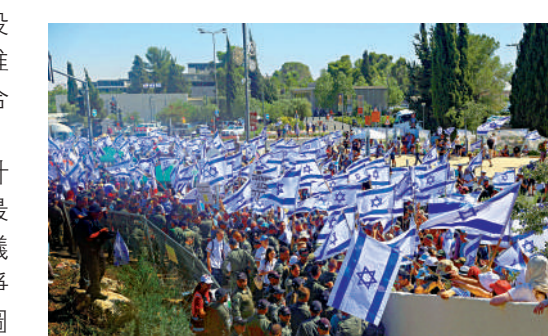
▲耶路撒冷24日爆發大規模示威。

會推翻最高法院裁決這項最具爭議的內容。法案通過前，大批以色列民眾已連續數日在全境發起示威活動，示威者從沿海城市特拉維夫出發，7月22日晚進入耶路撒冷，朝議會大廈方向前進。示威更有蔓延至軍隊的跡象，有示威者說如果政府繼續推動改革，數以千計後備役軍人將拒絕服役。以色列鎮暴部隊則出動水槍試圖驅趕示威者，並逮捕了至少19人。