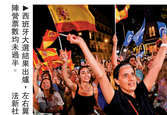
▲西班牙大選結果出爐，左右翼陣營票數均未過半。

【大公報訊】據《衛報》報道：西班牙內政部24日凌晨公布的初步計票結果顯示，在23日舉行的西班牙議會選舉中，右翼人民黨成為議會第一大黨，但沒有獲得單獨組建政府所需絕對多數席位。人民黨主席費霍和現首相桑切斯日前雙雙宣布獲勝。分析指，當前西班牙是歐盟輪值主席國且俄烏衝突未歇，此時陷入政治僵局，對歐洲造成打擊。