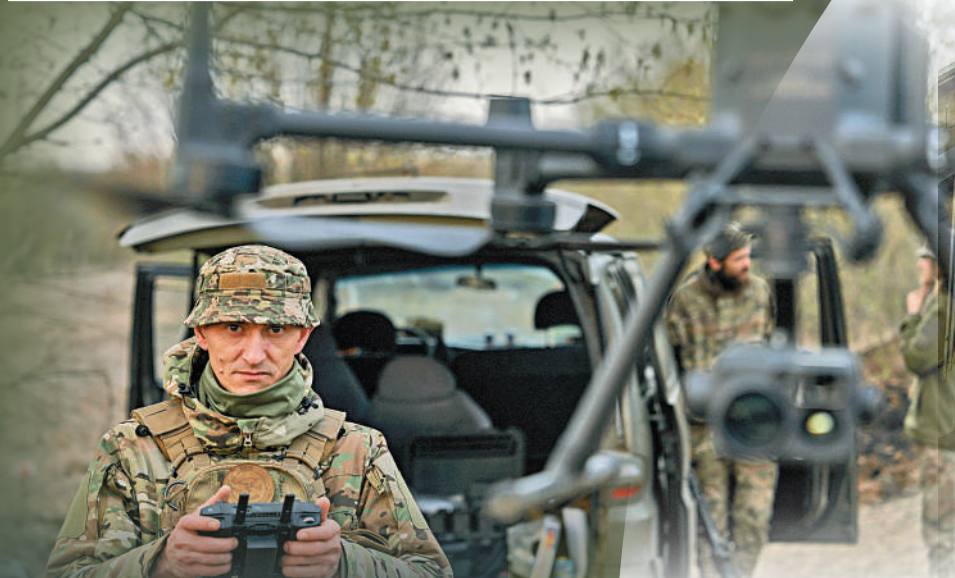
▲烏副總理稱將發動更多空襲，圖為烏士兵在前線發射無人機。