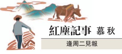
紅塵記事 慕秋 逢周二見報

對於孩子的物質要求，只要不過分，相信家長都會滿足他們，不過有所引導還是必須的吧？畢竟家中沒開銀行。