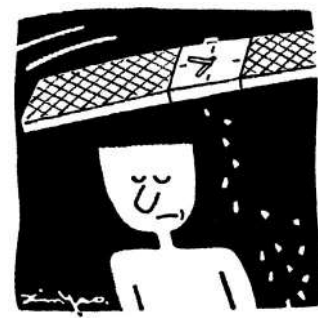
時間像把銼刀，什麼都可磨平。