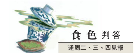
食色判答 逢周二、三、四見報