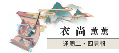
衣尚蕙蕙 逢周二、四見報

顏色方面，淺色是較顯著的流行色彩，紅色的T恤倒是十分耀目，今年是兔年，有名牌時裝的紅色兔仔衫，圖案設計可愛。大部分的紅色T恤，搭配清一色是經典的黑色為主。