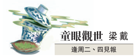
童眼觀世 梁戴 逢周二、四見報

十四年之後，在二〇二二年北京冬奧會閉幕式上，《我和你》悠揚的歌聲再次在鳥巢響起，帶着一份穿越的驚喜，致敬北京這座「雙奧之城」。