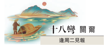
十八彎 關爾 逢周二見報

這些凡夫俗子。人生本是一場享受過程的修行，倘若生活遞來一杯苦酒，不如開懷飲下，靜待回甘。有天我們終會明白，理想的「長安」，總是來時歡喜，走時夢碎。待到「輕舟已過萬重山」，終會找到自洽的心境。把苦樂釀酒化詩，將生活讀出平仄，盡力保住心中那一團錦繡。或許這就是李白留給我們的，失意中的詩意吧。