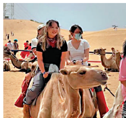
►雙膝曲跪在地上的駱駝。