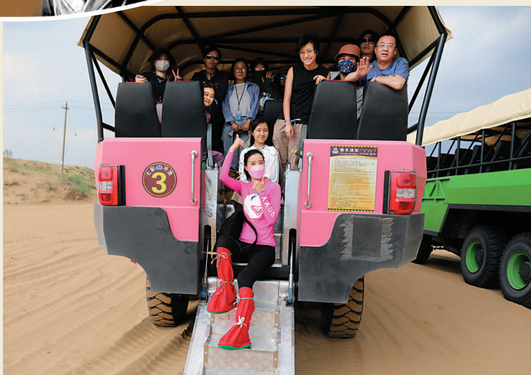
學子坐上衝沙車，感受馳騁沙漠的刺激。