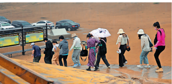
▲學子在沙漠遭遇暴雨冰雹突襲。

半晝的旅程，學子騎着駱駝信步在大漠黃沙之中；坐上衝沙車，感受馳騁沙漠的刺激。「你們快走