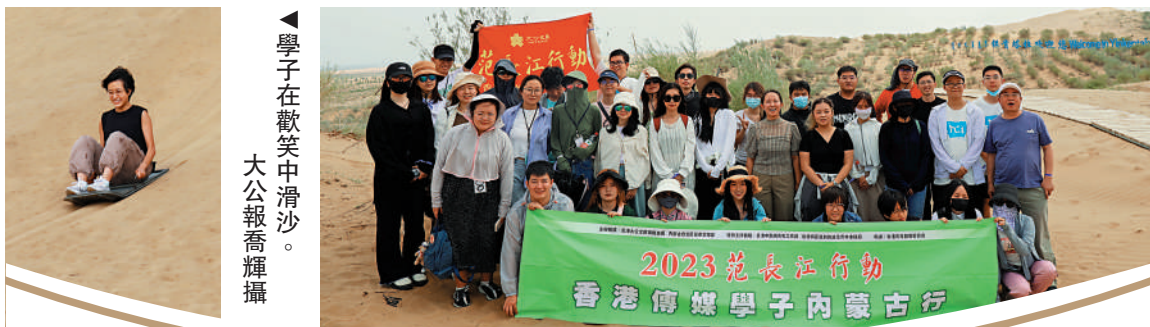
學子在歡笑中滑沙。