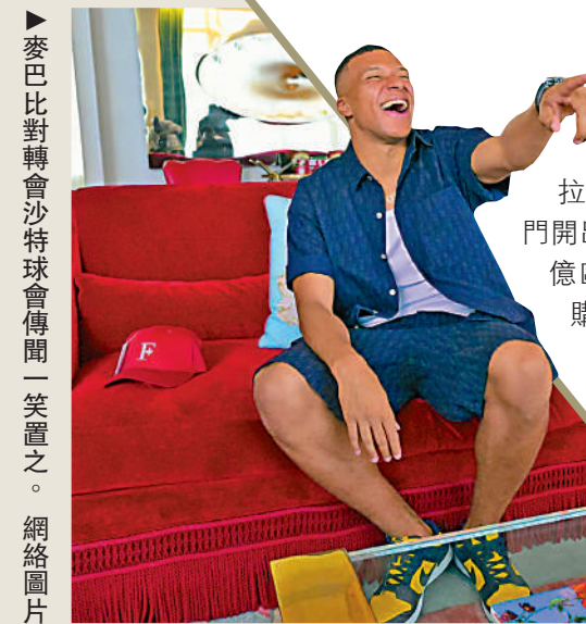
▶麥巴比對轉會沙特球會傳聞一笑置之。

【大公報訊】據每日郵報報道：日前爆出沙特球會希拉爾向巴黎聖日耳門開出破世界紀錄的3億歐元轉會費，收購法國國腳射手基利安麥巴比，獲聖日耳門方面接納並批准直接接洽。