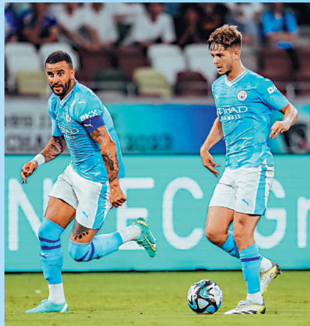
◀獲加（左）在熱身賽對橫濱水手被委任為隊長。