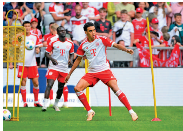
▶拜仁慕尼黑球員已開始新季集訓。