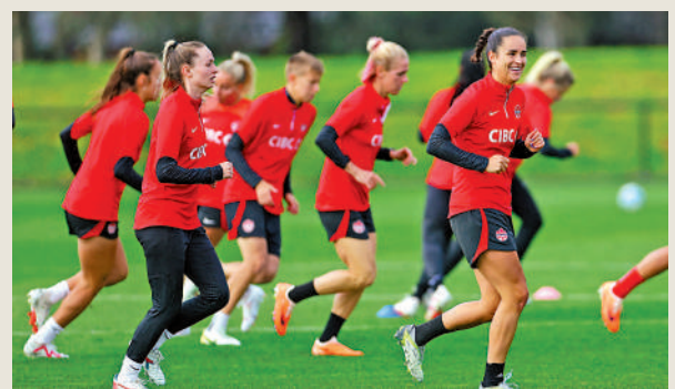
▶加拿大女足整體實力較愛爾蘭高，圖為加拿大球員備戰。