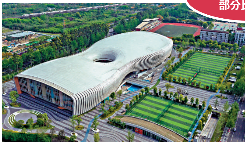
▲香城體育中心將舉行水球項目比賽。