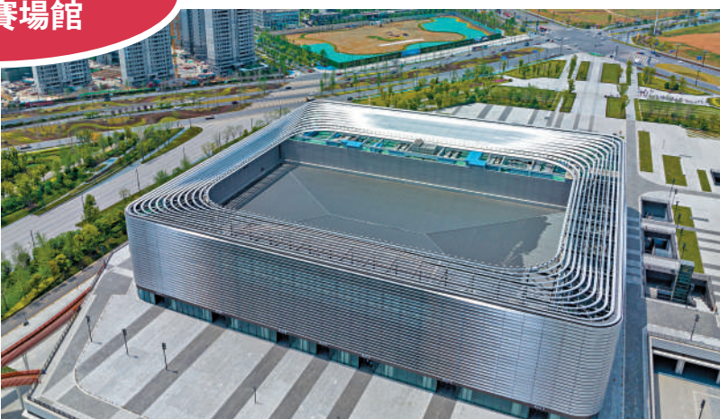
▲游泳項目在東安湖體育公園游泳跳水館上演。