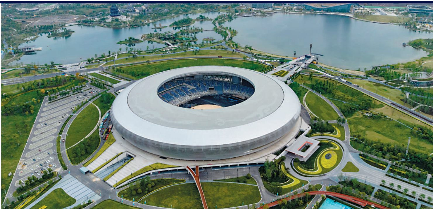
成都大運會開幕式今晚8時在東安湖體育公園主體育場舉行。

【大公報訊】成都第31屆世界大學生夏季運動會今天開幕，蓬勃向上的青春活力將在「大運之城」綻放。開幕式今晚8時在東安湖體育公園主體育場舉行，全體開幕式演員、志願者中，99%都是大學生。大運會將進行18個大項269個小項的比賽。賽事期間還將舉辦國際大體聯世界學術大會等教育活動及各類文化交流活動，進一步促進中國大學生運動員與世界各個國家和地區大學生運動員之間的交流。