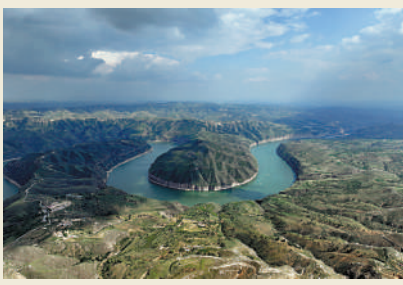
▲九曲黃河上呈現「几」字彎景觀地貌。

黃河几字彎是黃河環繞黃土高原，穿越鄂爾多斯，懷抱準格爾旗，跨過黃河大峽谷，形成的巨大「几」。黃河流經甘肅、寧夏、內蒙古、陝西、山西5省份接壤地帶的20個市縣，佔地近55.7萬平方公里，形成了九曲黃河上最大的「几」字彎景觀地貌。