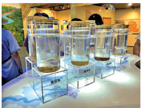
▲玻璃瓶裝載了黃河各段採集的水土石。