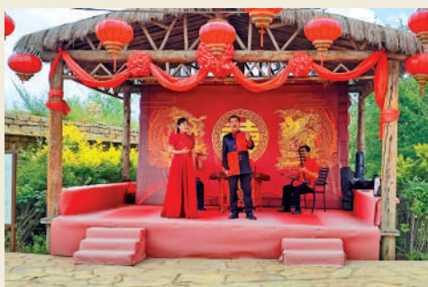
▲非遗漫瀚調已有逾百年歷史。