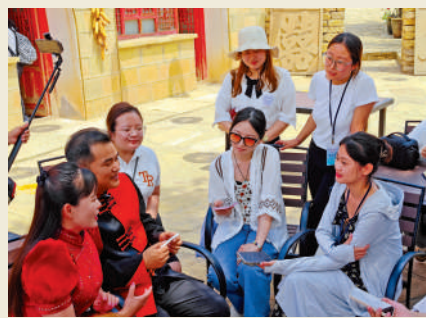
▲學子採訪漫瀚調非遗傳承人。