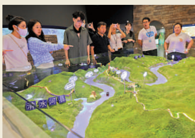
▲學子在觀看黃河大峽谷沙盤上的「几」字彎。