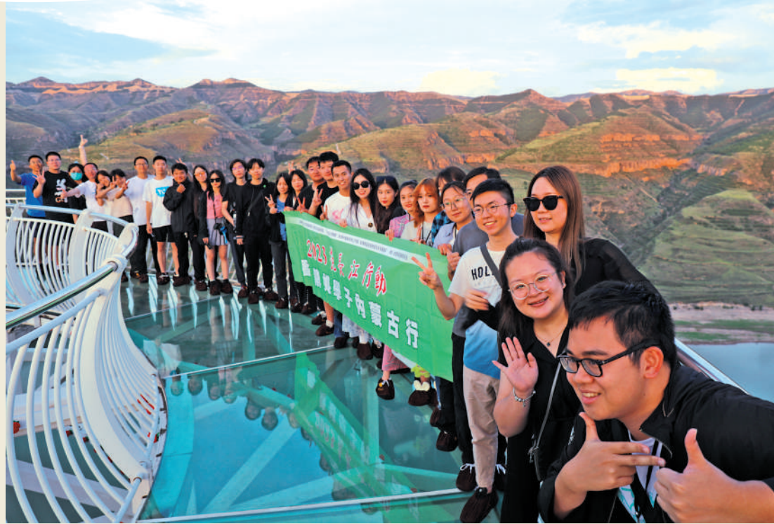
▲學子在黃河大峽谷懸空玻璃棧橋留影。