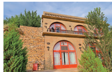
▲黃河大峽谷河景窑洞。