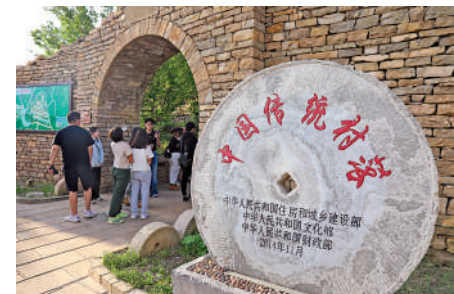
▲崔家寨古村是被奇峰險嶺環繞的小村莊。