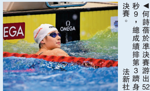
▲何詩蓓於昨晚(27日)7時02分爭奪世界游泳錦標賽女子100米自由泳金牌！她日前於200米自由泳僅得第4後，即於社交平台誓言捲土重來，昨(27日)以52秒9，總成績排第3闖入決賽，將跟澳洲名將奧嘉莉嫻和麥姬安等爭逐金牌。