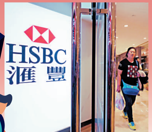
▲滙豐等主要本地銀行把最優惠利率上調0.125厘。