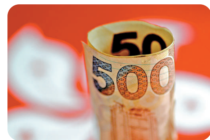
▲近月港匯比過去數月稍強，反映聯匯制度下自動利率調節機制的有效運作。

阮國恒說，在聯匯制度下，港息會逐步趨近美息；假如企業是以港元拆息作為借貸基準，將面對更高的借貸成本，惟至今未見對銀行客戶有太大影響並浮現出來，認為相關風險可控。