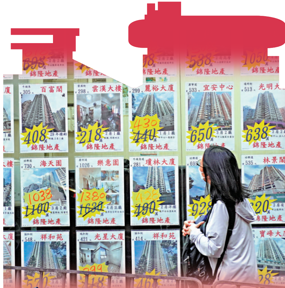
▲港銀加息後，供樓人士要為每100萬元的按揭貸款，每月供款增加70元。