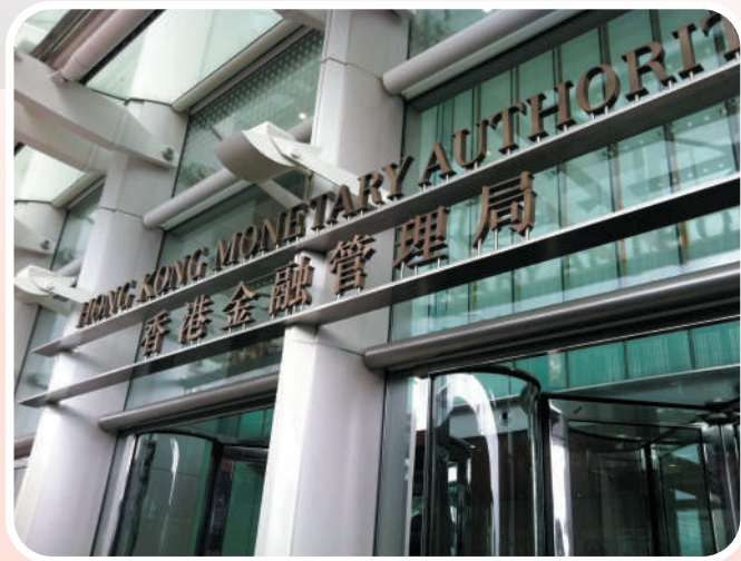
▲因應美聯儲加息25個基點，金管局也上調貼現窗基本利率至5.75厘。

量力而為 署理香港金融管理局總裁阮國恒表示，美聯儲自去年3月起累計加息525個基點，惟美國通脹依然高企，相信「高息環境或會維持一段時間」。在聯匯制度下，港元拆息已逐步上升，他呼籲市民對銀行借貸利率的波動應該有所準備，在作出置業、按揭或其他借貸決定時，小心考慮及管理好相關風險。