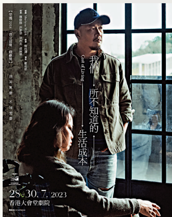
《我們所不知道的生活成本》今日起在香港大會堂劇院開演。