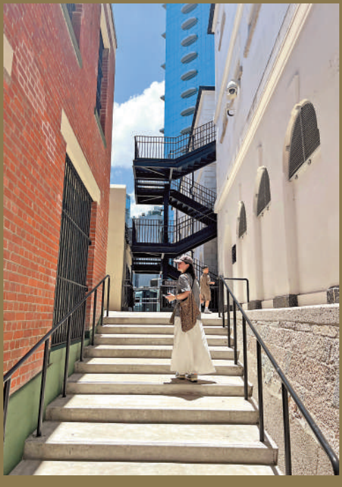
內地遊客在前身為中區警署建築群的香港大館參觀，與古蹟合影。