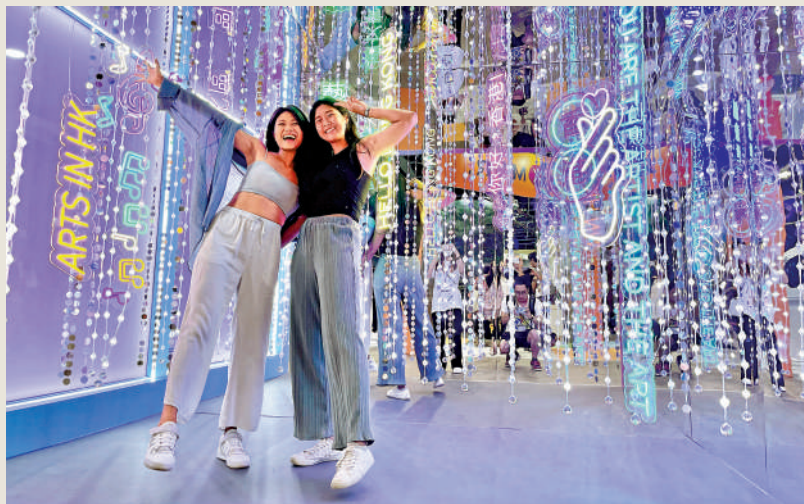
6月16日，香港國際旅遊展2023在香港會議展覽中心舉行，參觀者與香港特色燈飾合影。