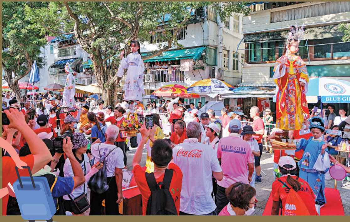
5月26日，香港長洲太平清醮飄色巡遊在長洲舉行，大批市民和遊客前往觀賞。

特首李家超曾在分析「五一」假期旅遊業狀況時表示，訪港旅客的喜好變得多元化，從名勝古蹟、主題公園、購物熱點到郊野公園、離島風光、地區小店，都深受旅客喜愛，充分展示香港的多元化魅力和軟實力。