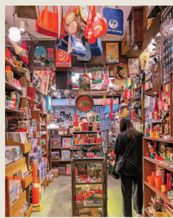
以懷舊為主題的香港舊物商店受到不少內地文青的青睞。