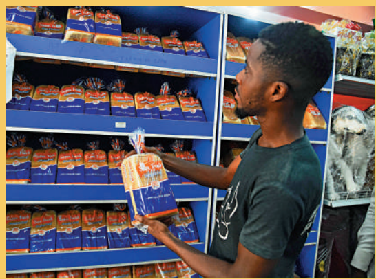
▲一名男子在尼日利亞一間超市看着貴價麵包。

本次峰會為期兩天，有17位非洲國家元首與會。首屆俄非峰會2019年10月在索契舉辦，當時有43位非洲國家元首出席。克里姆林宮發言人佩斯科夫指責美國及其盟友，通過其在非洲國家的外交使團，進