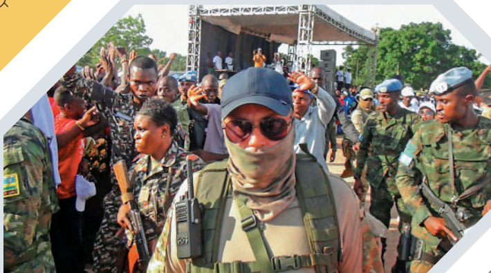
▼瓦格納士兵本月現身中非共和國。

現年62歲的齊亞尼從2015年起一直負責領導尼總統衛隊。2021年3月現總統巴祖姆宣誓就職前夕，齊亞尼曾率軍挫敗反政府軍事政變，這也促成該國1960年自法國獨立以來首次和平的權力移交。