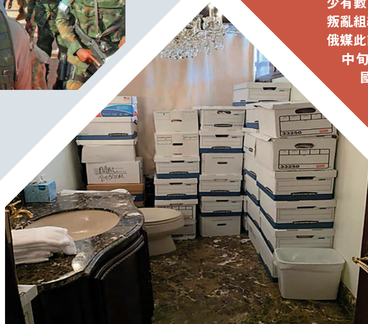
▲海湖莊園的衛生間內堆滿文件箱。

在鑽石資源豐富的中非共和國，至少有數百名瓦格納僱傭兵協助政府打擊叛亂組織，以及訓練中非部隊和警察。俄媒此前報道，數百名瓦格納士兵本月中旬飛抵中非共和國首都班吉。該國將於7月30日就新憲法草案舉行全民公投。有消息稱，瓦格納士兵屆時將負責維持秩序。克宮此前表示，瓦格納集團在中非共和國「獨立經營」，與俄政府無關。