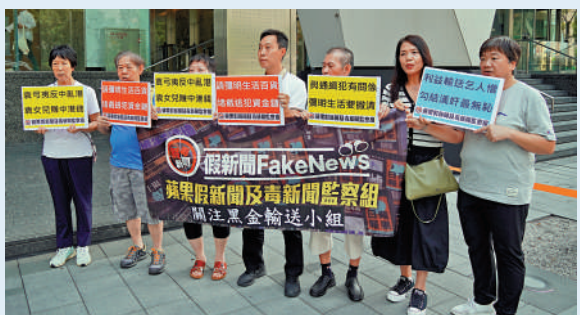
▲團體昨日到「彌明生活百貨控股有限公司」的股東大會示威。