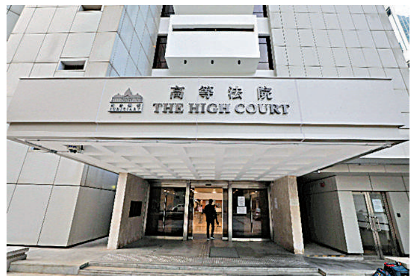
▲高院昨日拒絕就禁止與「港獨」歌有關的非法行為批出禁制令。

法官在判詞中指出，法庭不信納禁制令會有真正功用，而違反禁制令而進行的藐視法庭法律程序會涉及證明相關的刑事罪行，所以強制執行時不會更加容易，而法庭信納強制執行禁制令時會與相關的刑事法律互有衝突，舉例指，違反《香港國安法》的罪行須在刑事法庭提出檢控。