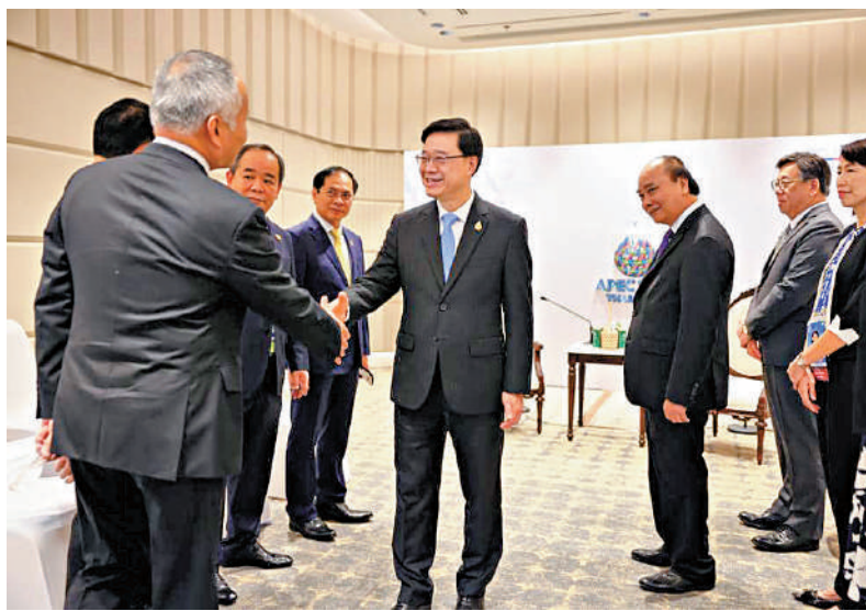
▲李家超去年出席於泰國舉行的APEC領導人非正式會議。

【大公報訊】記者龔學鳴報導：亞太經合組織（APEC）第三十次領導人非正式會議將於11月在美國三藩市舉行。美國《華盛頓郵報》27日引述所謂「三名熟悉情況的美國政府官員」透露，因制裁原因，美方將不邀請香港特區政府行政長官李家超出席。特區政府28日就此事回應表示，美國應切實履行東道主的基本責任，依照APEC的常規及一貫做法邀請行政長官以中國香港領導人身份出席會議。中國外交部同日表示，已提出嚴正交涉，中方將堅定維護中國香港參加APEC會議的正當合法權利。