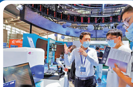
▲深企工作人員向參觀者介紹高端檢測設備。

上半年，深圳圍繞20大先進製造業園區建設、重點企業總部項目加快落地實施，共有134個重大產業項目開工建設。其中，投資超50億（含50億元）的重大項目有32個，包括深汕工業互聯網製造業創新產業園二期、前海深港國際服務城首創區項目等。