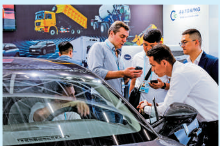
▲第133屆中國進出口商品交易會上，採購商了解新能源汽車產品。

目前，深圳已與東盟4個國家的6個城市結為友好城市或友好交流城市。同時，深圳機場口岸已開通9條前