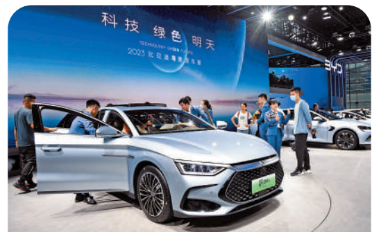
▲觀眾在粵港澳大灣區車展比亞迪展臺了解新能源汽車。