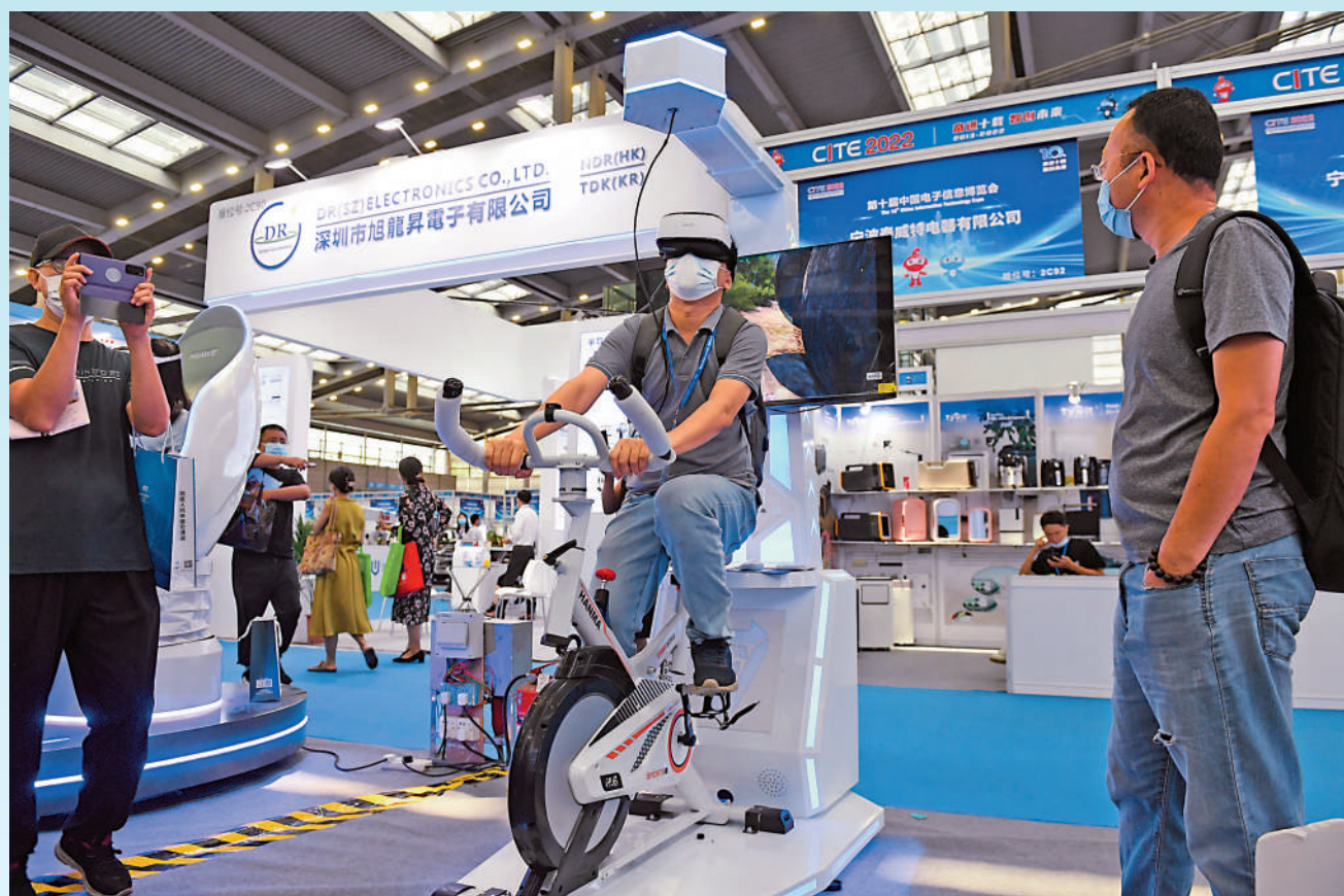
▲深圳全力擴投資、促消費、穩外貿，「三駕馬車」齊頭並進。圖為觀眾在深圳第十屆中國電子信息博覽會上體驗VR健身遊戲。

主要行業大類中，規模以上汽車製造業增加值增長89.7%，其中新能源汽車、充電樁產量分別增長170.2%、32.6%。中國（深圳）綜合開發研究院金融發展與國資企發展所執行所長余凌曲分析，深圳規模以上汽車製造業增加值增長約90%，這個成績是在去年增長104%的基礎上取得的，意味着深圳汽車製造業很可能實現兩年連續翻番。他認為該行業高增長主要是因為深圳把握了全球汽車製造綠色轉型、智能轉型的新趨勢，汽車製造業越來越成為深圳一個新興的支柱產業。