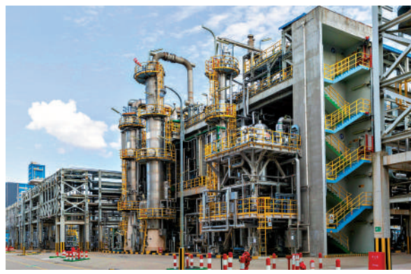
巴斯夫和中國石化合資興建的巴斯夫南京一體化基地。 巴斯夫官網