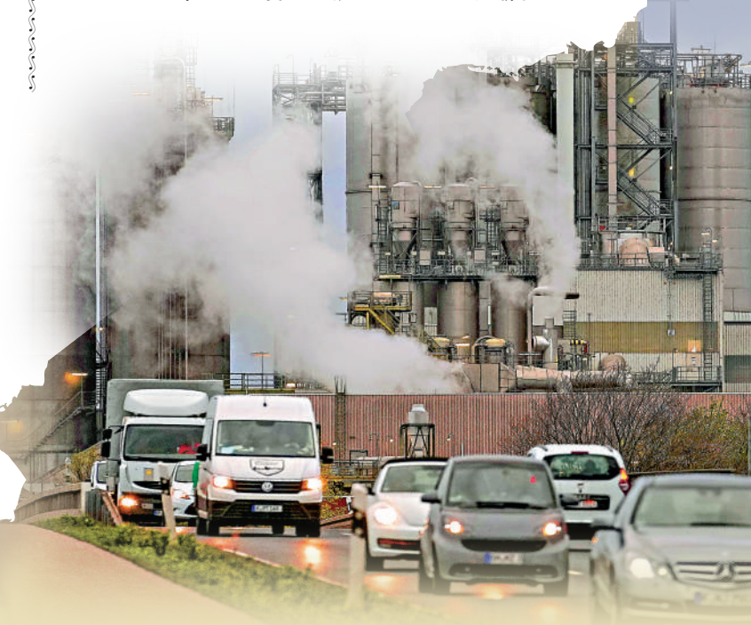
德國嚴重依賴能源進口，圖為科隆附近的化工廠。