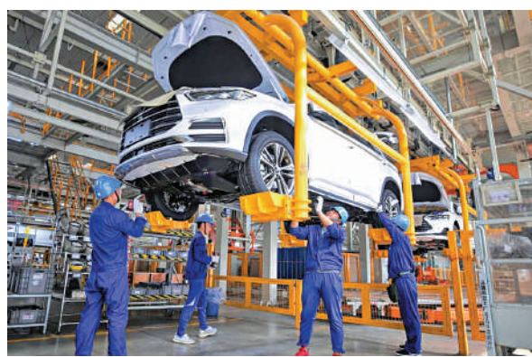
比亞迪為代表的中國電動汽車已打入歐洲市場，圖為比亞迪位於西安的工廠。