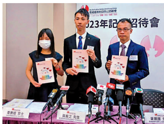
▲香港撒瑪利亞防止自殺會發表去年本港自殺死亡個案數據分析，按年齡分析，60歲或以上長者自殺死亡個案打破1973年以來的紀錄。

聯繫減弱，缺乏家庭支持容易產生輕生想法。長者在移民潮下受到的衝擊令人關注。香港基督教服務處今年4月亦公布有關調查結果，去年11月至今年2月訪問的203長者中，近四成（36%）有子女在2020年或以後移民；近七成的「留港長者」表示因子女移民而感到孤單，另有近七成「留港長者」有抑鬱傾向。