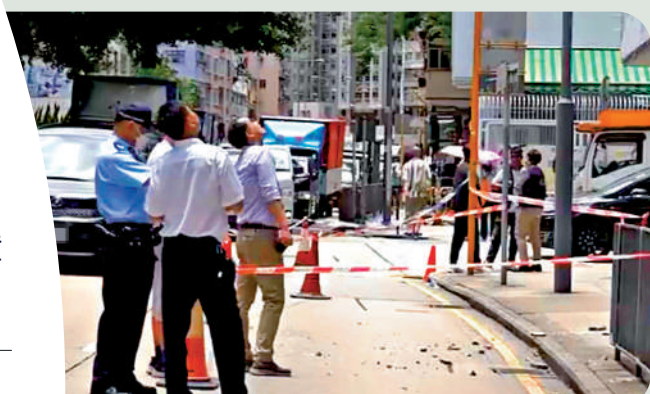
▲本月10日，旺角福強工業大廈外牆有石屎剝落，警方及屋宇署人員接報到場調查。

翻查資料，七月份已發生逾十宗大廈失修墮物事故，平均三日一宗，包括前日油麻地廟街一大廈及旺角新興大廈石屎剝落。最新一宗則為昨日葵興華星街華達工業中心B座，高處有石屎鬆脫墮下擊中一輛貨車。