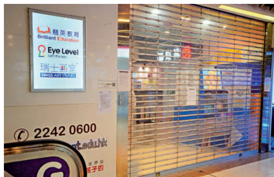
▲翹英教育中心全港五間分店突然全線結業。圖為康怡分店。