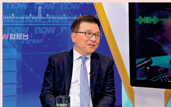
▲陳家強建議本地大學增加取錄海外學生，職業訓練局等機構亦要尋找機會，吸引更多內地生和東南亞生來港就讀。