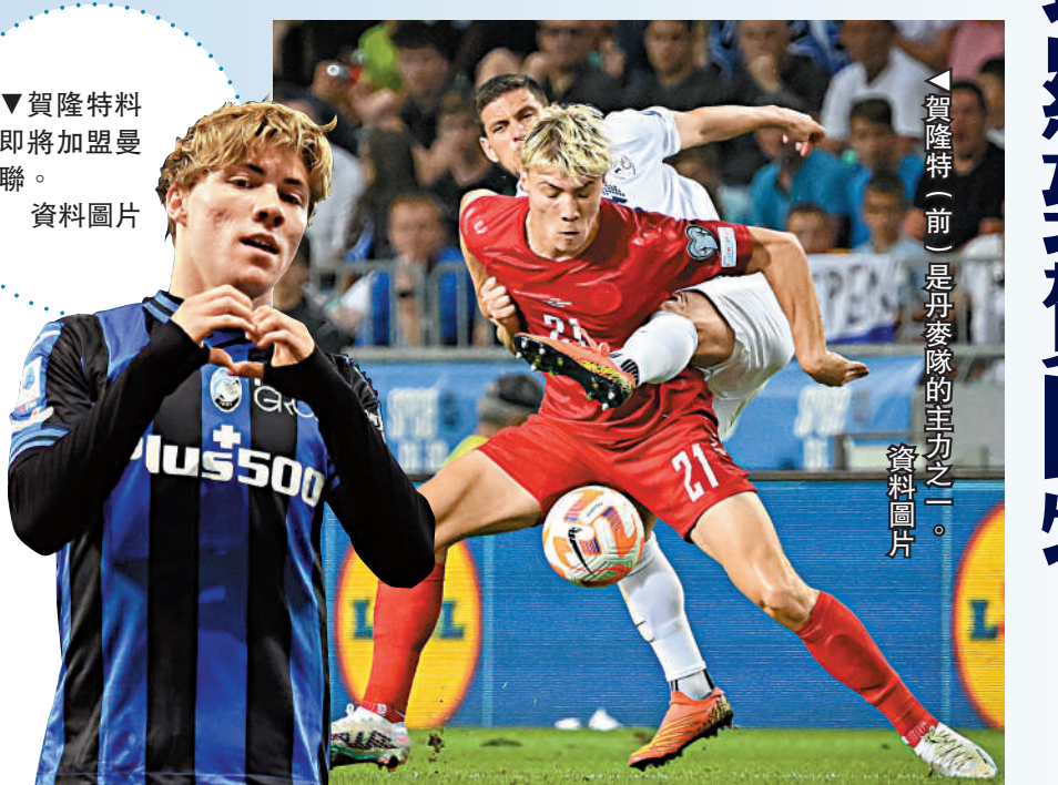
▲賀隆特（前）是丹麥隊的主力之一。

歐元從格拉茨收購賀隆特，所有賽事上陣34次、射入10球，當中正選披甲的比賽常有入球或助攻，在國家隊已披甲6次並入6球。賀隆特以「黃金左腳」見稱，亦獲讚賞「用腦踢球」，擅長走空位接應皮球或拉開對方守將，起動時間掌握準確，相信很適合曼聯陣法。