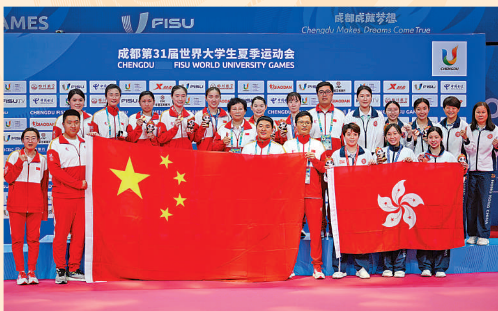
▲中國女乒隊成員和中國香港女乒隊成員在頒獎儀式上合影。