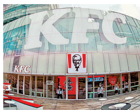
▲百勝中國位於上海第500家肯德基門店。

截至6月底止第二季，百勝中國總收入破紀錄達26.5億美元（約206.7億港元），按年增長25%，派息每股0.13美元（約1.014港元）。集團首席執行官屈翠容表示，去年第四季是整個市場最艱難之時，相信最壞時間已經過去，顧客的消費意欲重臨，惟平均消費更趨理性和審慎。她認為，中國餐飲市場龐大，公司在華中地區包括湖北、湖南及四川等地業務增長快速。