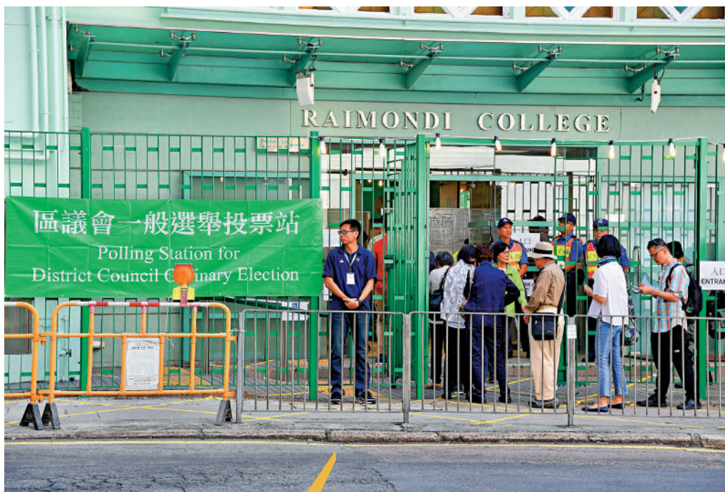
▲根據選舉事務處統計數字顯示，選民總人數連續兩年減少。圖為市民過往投票情形。資料圖片

此外，政府早前宣布，第七屆區議會一般選舉將於2023年12月10日舉行。提名期於10月17日開始，至10月30日結束。新一屆區議會由委任議員、地區委員會界別選舉產生的議員和區議會地方選區選舉產生的議員組成，數目比例約為4：4：2，另有27名當然議員，區議員總數將會有470名。