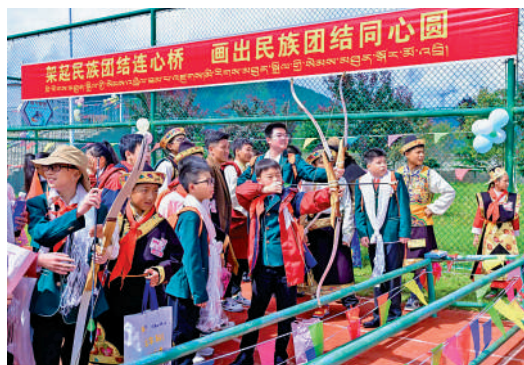
▲來自粵港澳大灣區的青少年與西藏青少年歡聚一堂，體驗民族文化。

活動圍繞「林海情深，粵動高原」主題，先後在米林縣白鷺文化廣場、林芝會展中心、魯朗小鎮舉辦了3場珠港澳—西藏林芝青少年交流音樂會，數百名各民族青少年聯袂登場，演繹《紅旗頌》《再唱山歌給黨聽》《天路》《阿酷茲巴》等動人旋律，共同奏響團結奮進的青春樂章。