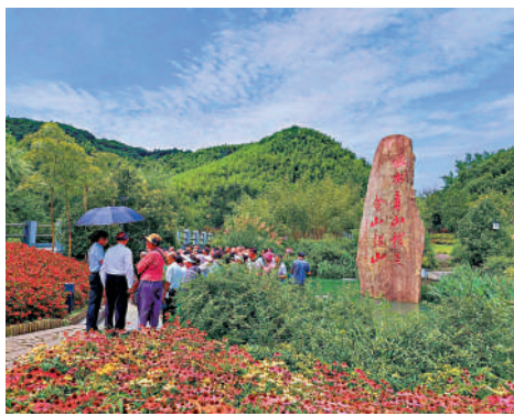
▲時任浙江省委書記習近平，2005年在浙江湖州市安吉縣余村提出「綠水青山就是金山銀子」，當地將此金句刻寫在大山石上，成為地標。

「今年是浙江『八八戰略』實施20周年，也是大公報舉辦『范長江行動』十周年，在這個重要的歷史節點上，今日啟幕的2023『范長江行動』——香港傳媒學子浙江行具有尤為特別的意義。」作為採訪團的團長，李大宏對活動報以殷切的寄望。他表示，希望同學們通過深入探訪浙江各地，一邊行走，一邊採訪寫作，用香港年輕人的視角和語言，向港人和海外受眾講述浙江故事。