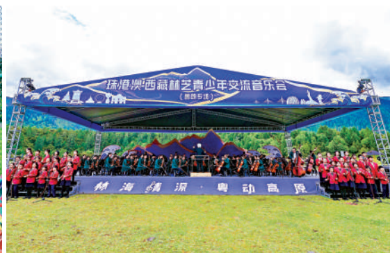
▲珠港澳西藏林芝青少年交流音樂會（魯朗專場）現場。