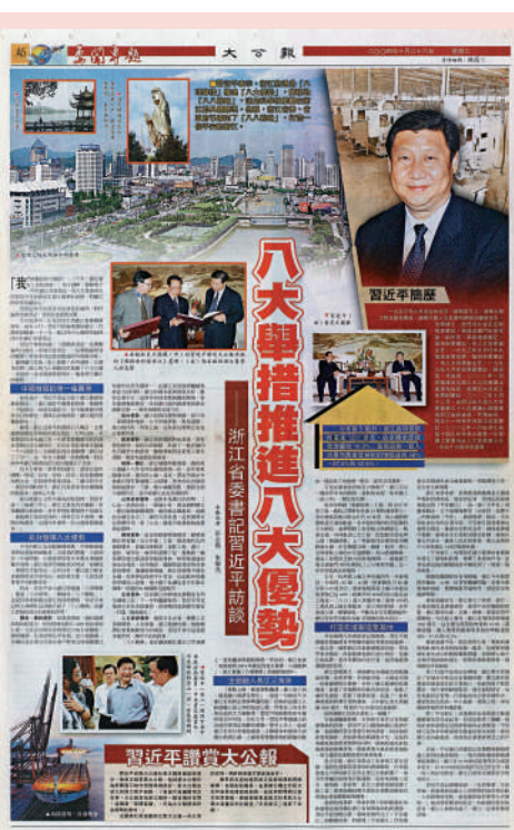
▲2004年10月26日《大公報》刊發時任浙江省委書記習近平訪談，最早向香港以及海外傳播「八八戰略」。