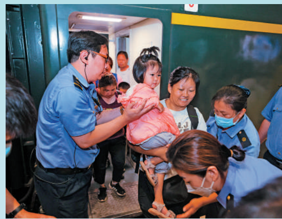
▲K396次列車第二批滯留旅客在鐵路工作人員協助下有序出站。