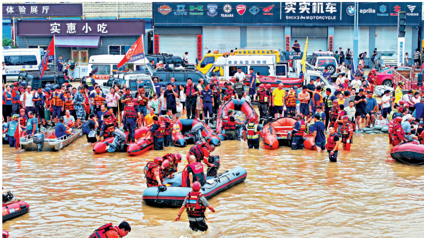
華北地區日降水量突破歷史極值站點