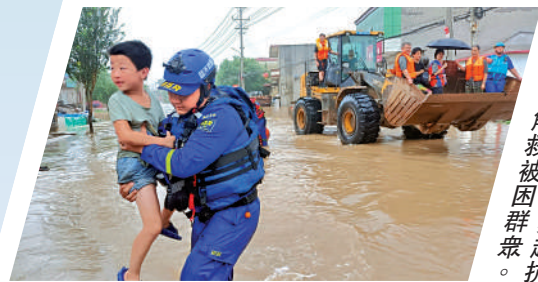
▲洪一線，藍天救援隊隊員奔赴搶救被困群眾。

21支來自河南的救援隊組成中原聯盟救援隊，共計187名隊員，39艘衝鋒舟，前往河北寧晉縣參與救援。洛陽市伊川縣神鷹、蛟龍、老兵三支救援隊先後出動30餘名隊員，在當地應急管理部門的指揮下開展緊急救援工作，截至8月1日下午，先後救出當地500多名被困群眾。