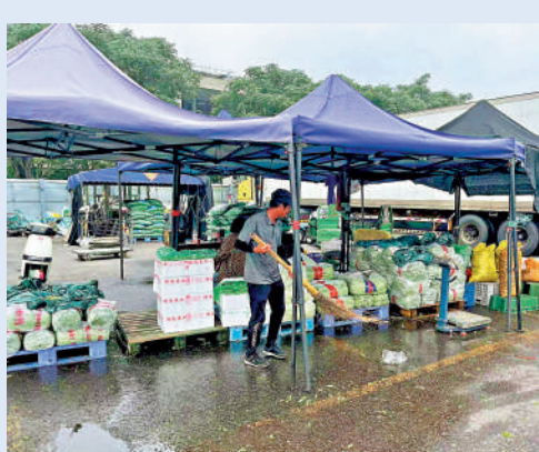
▲雨停後一位北京菜商清理攤位附近的積水。

備。通過商戶微信群、廣播等渠道提前告知商戶，提前進行農產品採收和儲備，做好運輸路線安排，確保主要蔬菜品種供應充足。