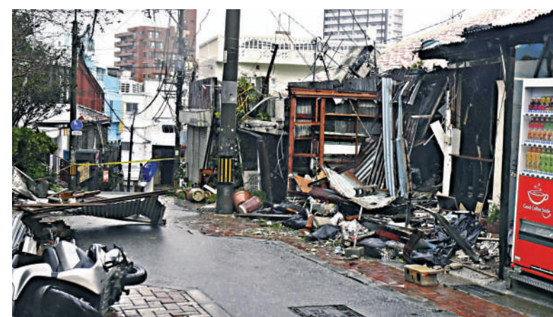
▲颱風「卡努」2日吹襲沖繩，那霸市有建築物受損。

強風導致沖繩縣約21.5萬戶停電，近70萬人收到撤離通知。沖繩本島全境出現路面淹水、樹木傾倒，及因車輛翻覆導致道路通行中斷等狀況。沖繩那霸機場自8月1日起關閉。日本交通部說，1日和2日共有951個航班取消，35條渡輪航線暫停運營。