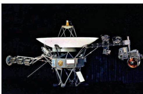
▲NASA發錯指令，導致「旅行者2號」天線向外傾斜。

絡和無線電科學小組幫忙聆聽「旅行者2號」的音訊，結果「聽到從這艘太空船發出的「心跳」信號（即載波信號）」，表