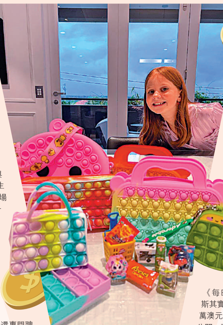
▲寇蒂斯10歲時就擁有自己的玩具公司。

來自美國得州的烏爾默更是年僅4歲就開始創業，靠「秘密配方蜂蜜檸檬水」成為CEO，產品暢銷美國。不過，有分析指出，這些兒童企業家的父母要麼做銷售工作、要麼是資深公關，還有的是知名會計師事務所顧問，他們無一例外深度參與孩子的商業活動，為孩子保駕護航。