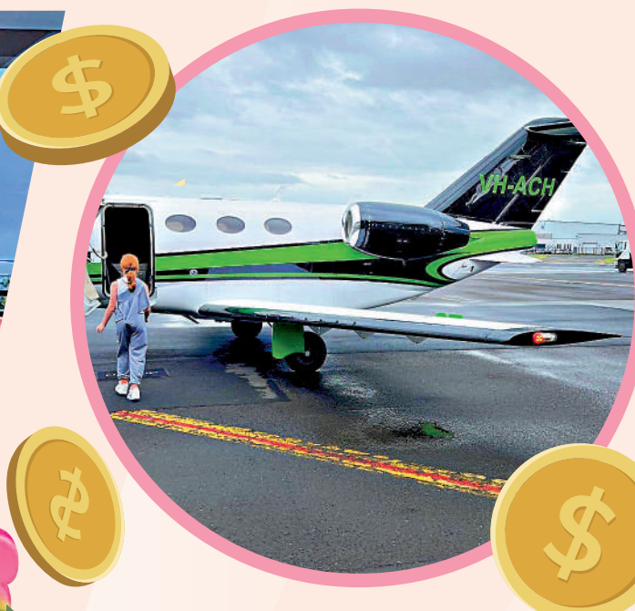
▲寇蒂斯生活奢華，經常乘坐私人飛機出行。