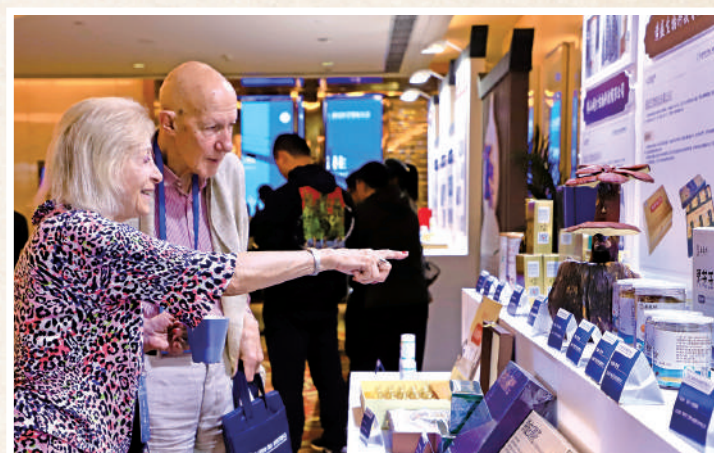
▲新安醫學發展大會上的國際嘉賓。

黃山，正以一座世界名山的高度、文化名城的厚度與全球對話，加快建設更具國際化、高端化、專業化的國際會客廳，更好展現中國風範、安徽風采、黃山風韻。