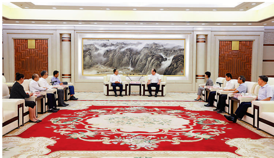
▲浙江省委常委、寧波市委書記彭佳學會見香港大文匯傳媒集團董事長李大宏一行。

【大公報訊】記者王莉寧波報導：8月4日，浙江省委常委、寧波市委書記彭佳學在寧波會見香港大文匯傳媒集團董事長、總編輯兼大公報社長、香港文匯報社長李大宏。