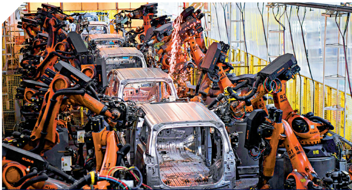
▲廣東日前發布「製造業外資17條」措施，擴大外商投資流入。圖為廣東一車企車間內，機器手臂在進行焊接作業。

「港資企業同時有外資和內資成分，擁有雙重身份，可謂『左右逢源』。若能充分利用好『雙重身份』的優勢，同樣可發揮作為溝通橋樑的角色。」林江認為，只要港企善用「雙重身份」，便可扮演好外資進入廣東市場的先導角色。