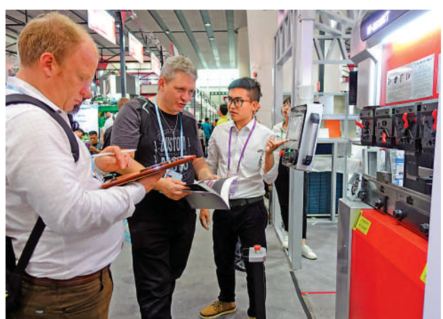
▲外國商人在廣州尋找貿易合作機會。

據了解，廣東省發展改革委等6部門近日聯合印發《關於以製造業為重點促進外資擴增量穩存量提質量的若干措施》，針對擴增量、穩存量、提質量三方面提出17條具體措施（下稱「17條」）。其中明確，支持外商投資新開放領域，深入實施新版外資准入負面清單，加快推進製造業領域開放舉措落地見效。