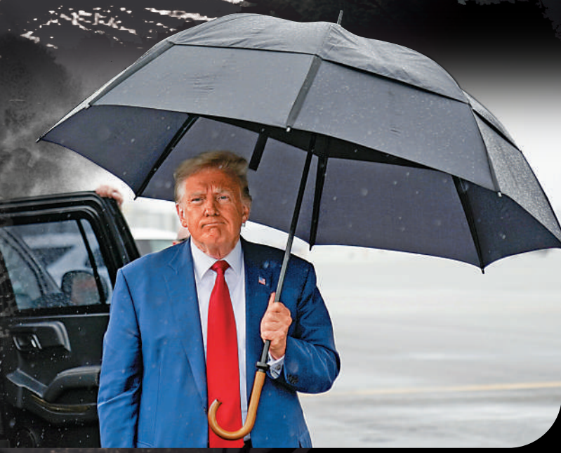
▲美國前總統特朗普3日離開法院後見記者。

特朗普目前是「封口費」案、「密件門」案和「推翻大選」案3宗刑事案件的被告。Politico網站稱，如果特朗普的所有罪名都成立，並且每項罪名都被頂格判罰，那麼他將面臨長達641年的牢獄之災。不過這一數字只存在理論上的可能性，因為特朗普沒有案底，這樣的被告很少被判處最高刑期。如果特朗普在同一案件中被判多項罪名成立，那麼這些罪名的刑期可能會同時執行，而非疊加執行。