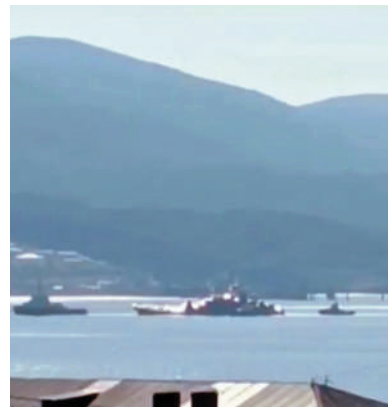
▲一艘俄軍艦4日被拖曳回新羅西斯克港口。

在此運營石油碼頭的裏海管道集團稱，新羅西斯克港口短暫停止了所有船舶活動，現已恢復正常運作。這個港口處理的石油佔全球供應量2%，同時也出口穀物。