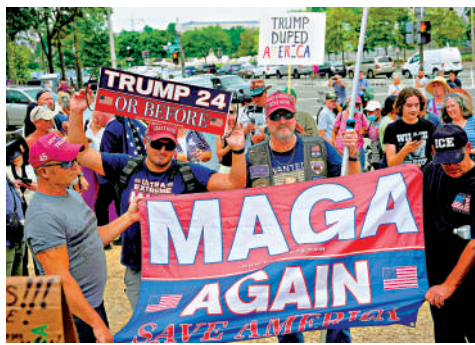
▲特朗普的支持者3日在聯邦法院外集會。

和前兩次被刑事檢控一樣，特朗普依然把自己塑造成「受害者」，以鞏固基本盤的支持，讓被告成為他參選的助力。截至8月1日的民調顯示，特朗普在黨