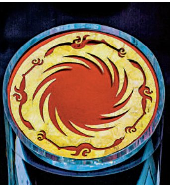
▲金沙遺址出土的「太陽神鳥」金飾。

同時，這一展廳裏的黃金面具、十節玉琮、玉器、青銅器等文物，亦從多個側面反映了金沙遺址和三星堆遺址之間強烈的文化承襲與發展關係。