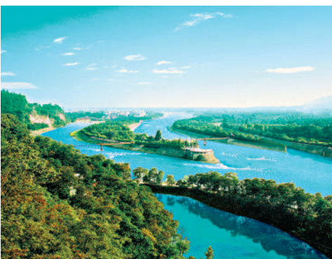
▲都江堰水利工程俯瞰。

站在沙盤旁，導賞員將都江堰水利工程的建造原理娓娓道來。都江堰充分利用西北高、東南低的地理條件，根據江河出口處特殊的地形、水脈、水勢等，乘勢利導、無壩引水、自流灌溉，使堤防、分