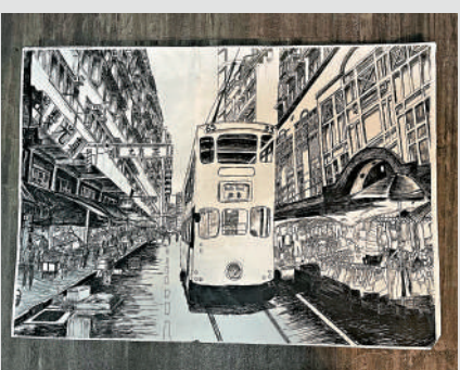
▲春秧街別具香港風情，是現代畫家熱門寫生對象。

「高樓林立，採購奢侈品，是香港的一面；菜場檔口，討價還價，也是香港的另一面。」北京市民臧先生回憶自己在香港旅行的經歷說，「人們愛香港，不僅愛它的繁華，也愛她的接地氣。那種並不凌亂的無序感，還有錯位時空的駁雜感，也是香港最大的魅力之一。」