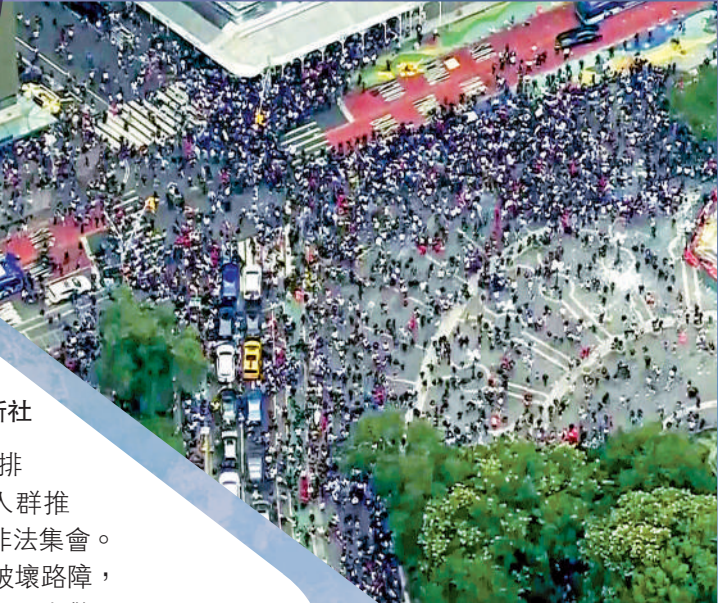
▲電視台畫面顯示，紐約聯合廣場周圍聚集了大量人群。

美國直播平台Twitch名人、在社交平台擁有逾千萬粉絲的21歲網紅賽納特，在當地時間4日下午1點在社交平台Instagram發文，號召粉絲於當地時間4日下午前往曼哈頓下城的一場直播活動，粉絲可見到他本人，且有機會得到PlayStation 5遊戲機等禮物。