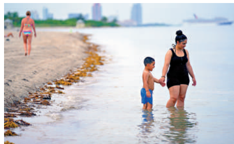
▲7月28日，人們在佛羅里達州海岸游泳。

的90%的多餘熱量，隨著溫室氣體持續排放，地球上多餘的熱量也會不斷增加。根據政府間氣候變化專門委員會2019年的報告，自1982年以來，海洋