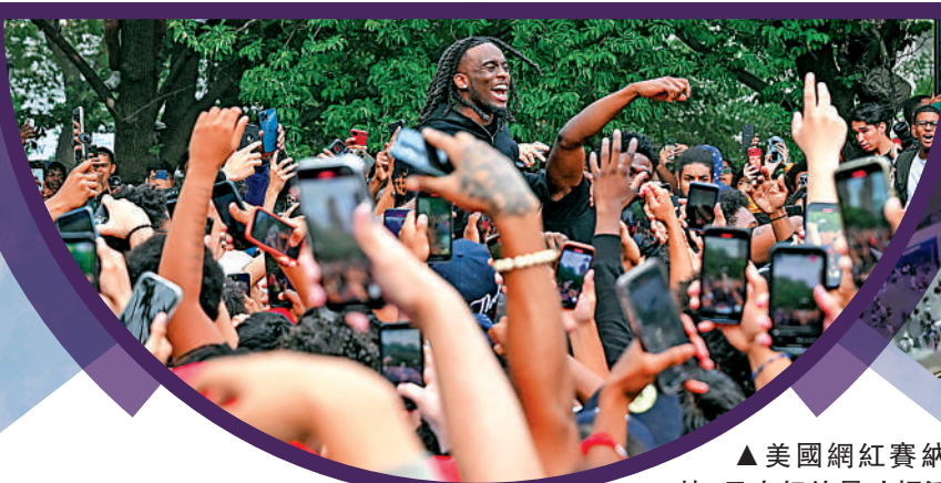
▲美國網紅賽納特4日在紐約曼哈頓派發遊戲機等禮品，引發騷亂。