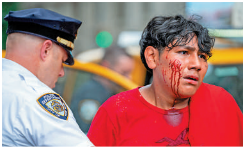
▲紐約警察在現場逮捕了一名臉上流血的鬧事者。