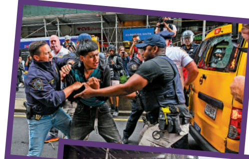
▲紐約警察逮捕現場的鬧事者。