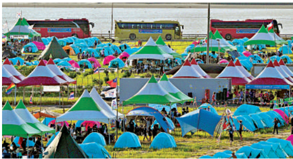
▲韓國全羅北道扶安市正舉行世界童軍大露營活動。法新社

會議，批准60億韓圓（約3600萬港元）支援世界童子軍大露營。韓國《中央日報》批評當局籌辦活動不力，導致童軍大露營變成大型的「荒野求生」。韓國全羅北道扶安市正舉行世界童軍大露營活動。法新社