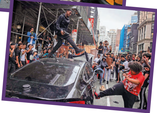
▲有人在集會現場破壞停在路邊的車輛。